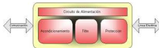
Figura No. 2. Módulo transceptor.