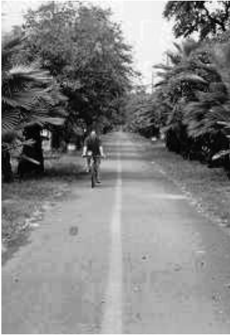
Ciclo-ruta de la Avenida Pasoancho

Aunque el intento de crear condiciones para la movilidad segura de ciclistas a través de este tipo de ciclo-ruta merece todos los elogios, infortunadamente la medida tiene limitaciones muy serias. Por un lado pesa la muy limitada extensión de la red de ciclo-rutas en la ciudad: apenas 300 kilómetros de una red vial de cerca de 10.000 kilómetros. Los ciclistas siguen arriesgando su vida y salud en más que 95 % de las calles después de salir de la ciclo-ruta. Ir en bicicleta sigue siendo muy peligroso bajo estas condiciones.