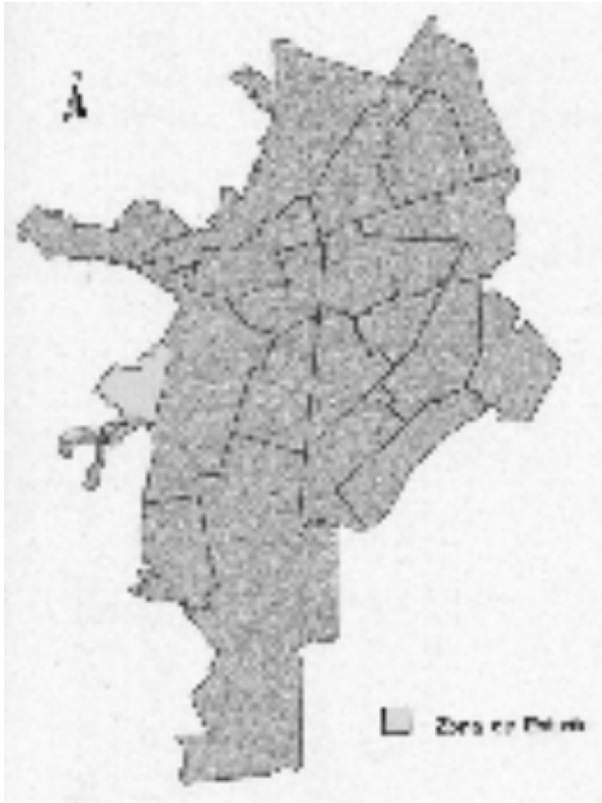
Figura 1: Comuna 20