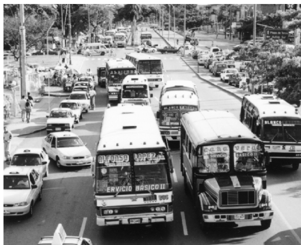
La sobreoferta de buses en diferentes partes de la ciudad. -Aquí en la Calle 5, frente al Éxito- hace que los buses se frenen mutuamente. Entre otros, por eso el transporte público colectivo en Cali es tan lento.

En partes de la ciudad, en especial en el centro, hay una sobreoferta de buses que se frenan mutuamente. En otras partes de la ciudad, en especial en los barrios marginados no hay o sólo hay un mal servicio.