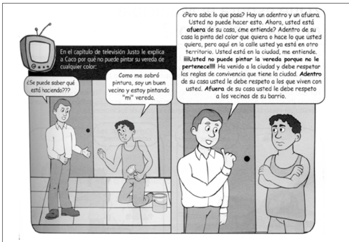
Capítulo 4: La importancia de una organización ciudadana.

c rutinio alguno, y donde el propio alcalde ha reaccionado contra manifestaciones de resistencia de los vendedores ambulantes con llamadas a “que se vayan a protestar de vuelta en el campo”. De hecho, los materiales de Aprendamos refuerzan, a pesar de su explícita agenda pro tolerancia, la idea de que la incivildad citadina es el resultado directo del salvajismo rural importado por los inmigrantes.