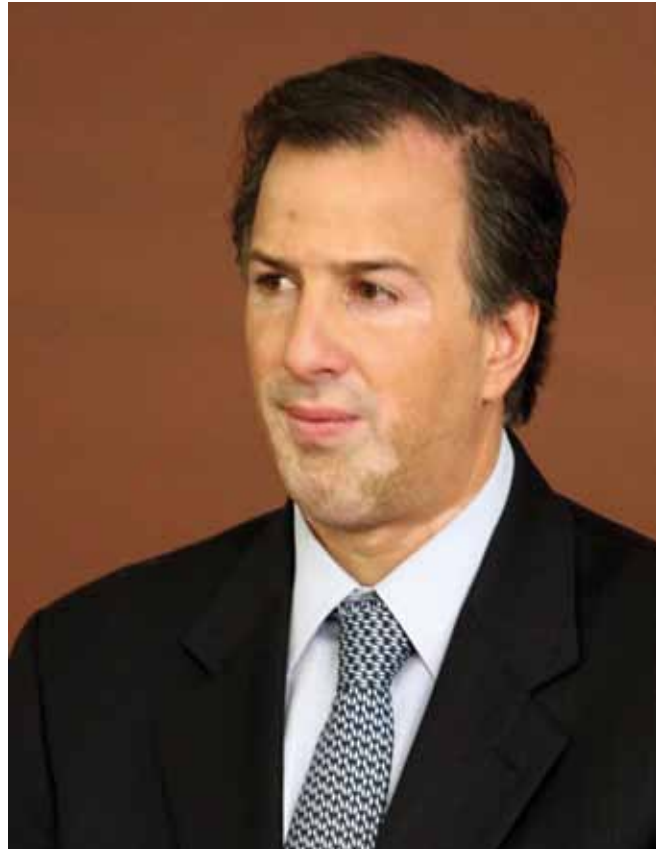
JOSÉ ANTONIO MEADE KURIBREÑA Secretario de Hacienda y Crédito Público

El día de hoy se pone a disposición del público la información preliminar sobre la situación financiera y la deuda del sector público a mayo de 2012.