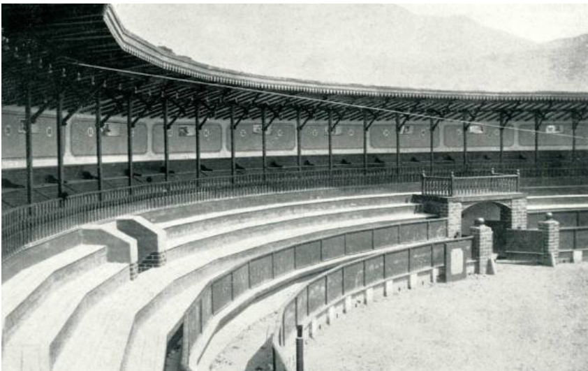
Interior del Circo-Teatro España según la lente de García.

Fuente: Archivo Fotográfico Biblioteca Pública Piloto