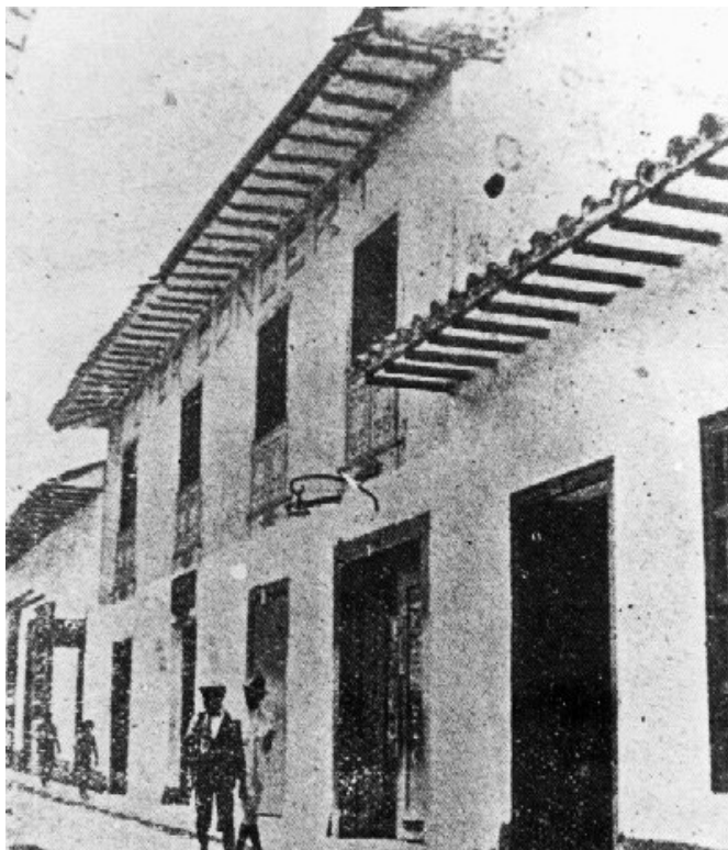
Teatro Principal antes de su remodelación en 1917.

Desde las lejanas tierras de Cuba, llegó a Medellín, en mayo de 1894, el prestidigitador Rafael Cabrera de la Barquera, quien ya era conocido en Bogotá y otras ciudades de Suramérica. En su primera función, verificada el 3 de mayo de ese año, acompañado por la orquesta local, "ejecutó [en el Teatro Principal] algunas suertes muy viejas y muy malas y otras muy nuevas y muy buenas; estuvo muy afable, pero simple" 6 , debido a que su situación económica, como su estado de salud, no era la mejor y anhelaba regresar a su país. De ahí que no solo pensara en Medellín para dar