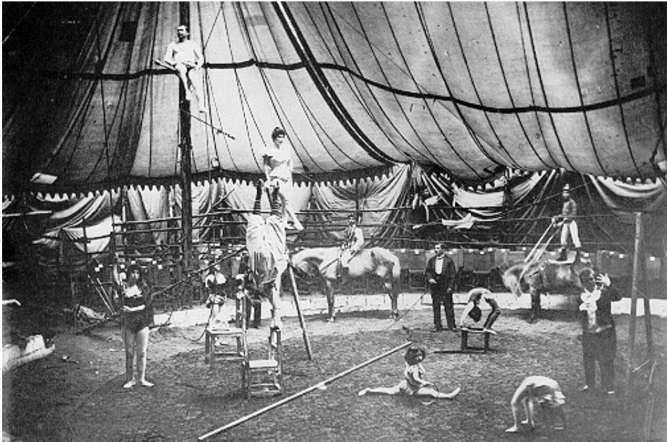
Circo, 1900.

que sus espectáculos eran muy afines: acrobacias en alambres tensos, payasos y gimnasia. Entre estas compañías, estuvieron la de Antonio N. Guerrero, que incluyó vuelos en globo; la del equilibrista norteamericano Harry Warner; la Compañía Americana de Santiago García y Justo Artiles, en 1895, y la Compañía Brasileira de equilibristas, gimnastas y acróbatas de José Alves Da Cruz, en 1896 34 . Como ellas, muchos otros se unieron a la lista de prestidigitadores, circos y transformistas que visitaron Medellín durante los veinte años que van de 1890 a 1910. No obstante, la intención del artículo, tanto en este aparte como en los que siguen, no es otra que sentar un precedente, a riesgo de ser generalizado, que oriente a quienes se interesen por el asunto de las diversiones públicas locales.