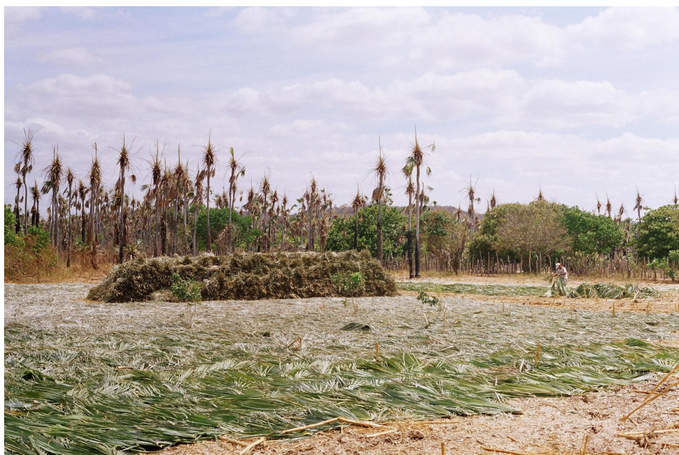
Foto 04: Ao fundo palmeiras de carnaúba após corte das palhas; no primeiro plano palhas de carnaúba secando ao sol e outras já recolhidas após secagem.

Ressalte-se que as palhas de carnaúba são utilizadas como adubos e na produção artesanal de produtos utilitários e de decoração. Na Foto 04 mostra-se palhas expostas ao sol para a secagem.