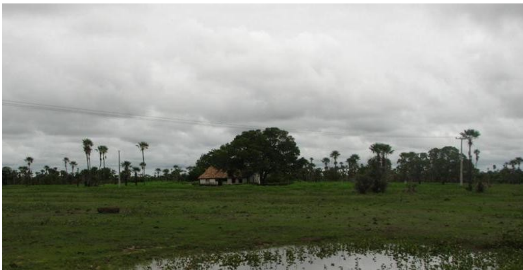
Foto 02: Típica casa sede de antiga fazenda de criação de gado na bacia do rio Longá

Dentre, as várias cidades localizadas na bacia do rio Longá, Campo Maior pode ser considerada uma das primeiras a se formar, pois o seu povoamento começou em meados do século XVII quando da criação da freguesia de Santo Antônio do Surubim. Já no século XVIII essa freguesia é levada a categoria de cidade na data aproximada de 19 de junho de 1761. É importante ressaltar que nessa freguesia a principal atividade era a criação de gado vacum. Dessa forma, na Foto 02 observa-se uma propriedade típica do município de Campo Maior que conseguiu resistir à ação do tempo: