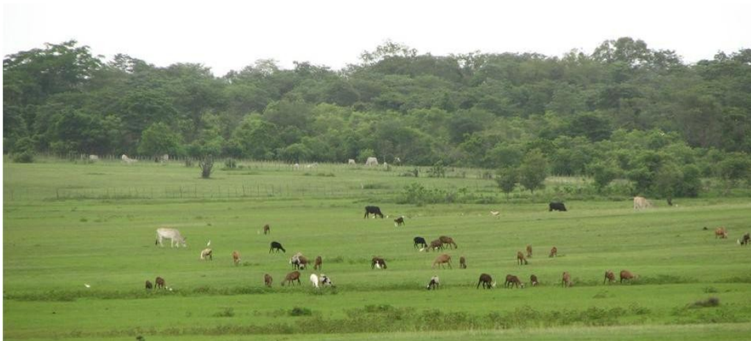
Foto 05 Criação extensiva de gado na bacia do rio Longa.

É importante ressaltar que aliada à extração vegetal (carnaúba, madeira, babaçu) também existe a criação de bovinos, suínos, caprinos e ovinos. Na Foto 05 mostra-se animais pastando em campos de pastagem natural, típicos da área no período chuvoso.