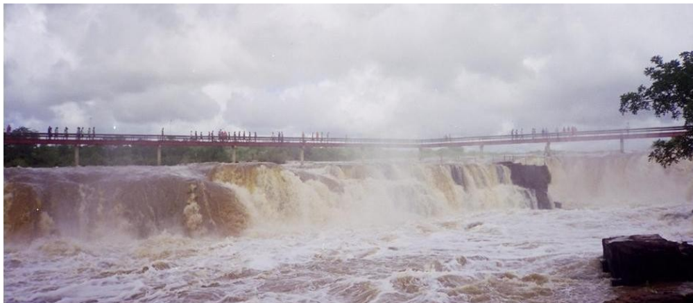
Foto 06: Cachoeira do Urubu no rio Longá (Esperantina/Batalha-PI.

paisagem através de um desnível no leito rochoso do rio na área do parque e que segundo Batista (1981) essa queda d'água possui uma altura de 13,40m formando um belo espetáculo natural, o qual pode ser verificado na Foto 06.