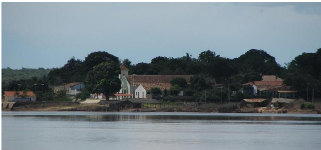
Foto 03: Povoado Barra do Longá, situado na foz do rio Longá, no município de Buriti dos Lopes

Na foz do rio Longá no município de Buriti dos Lopes que por sua vez teve o seu povoamento em meados do século XIX sendo que no início do século XX criou-se a Vila, mas na data de 31 de dezembro 1938, Buriti dos Lopes recebe a denominação de cidade. A sede do município fica um pouco mais afastada da margem do rio, tendo em vista as condições físicas do terreno para a expansão da área com edificações. Na Foto 03 vê-se um dos primeiros núcleos de povoamento do municípios, denominado Barra do Longá, situado à margem do rio Parnaíba