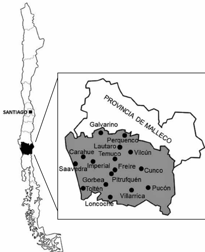
Mapa 1. Localización de la región de La Araucanía y de la provincia de Cautín