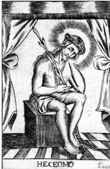
Imagen 1. “Ecce Homo”