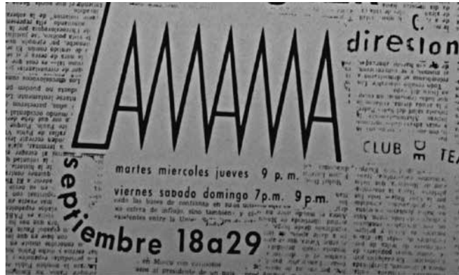
1. Cartel de El mendigo o El perro muerto