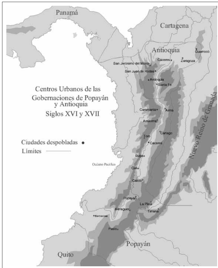
MAPA 1: CENTROS URBANOS DE LAS GOBERNACIONES DE ANTIOQUIA Y POPAYÁN (SIGLOS XVI Y XVII)