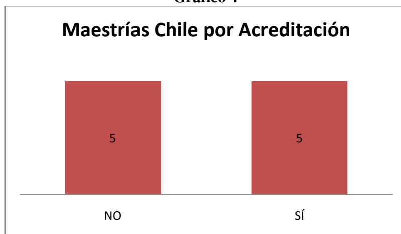
Maestrías Chile por Acreditación