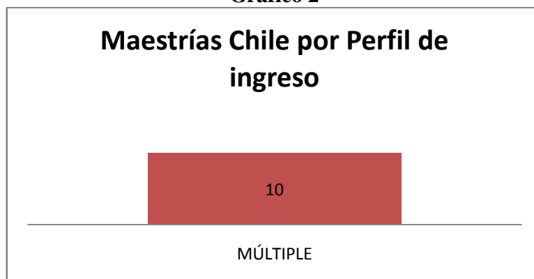
Maestrías Chile por Perfil de ingreso