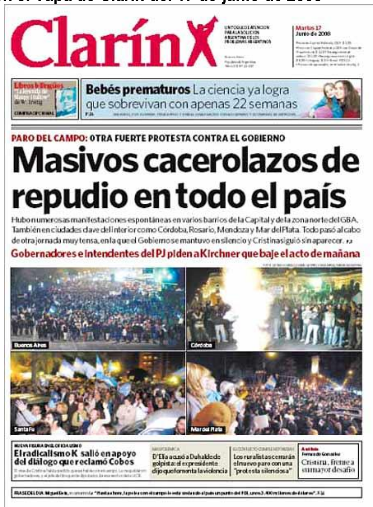
Imagen 5. Tapa de Clarín del 17 de junio de 2008

Tipo de página en que se publicó la información. Existe acuerdo en que la página impar da mayor visibilidad a las noticias, por lo que la ubicación de los artículos en éstas jerarquiza la información. Así, un 52,6% fue ubicado