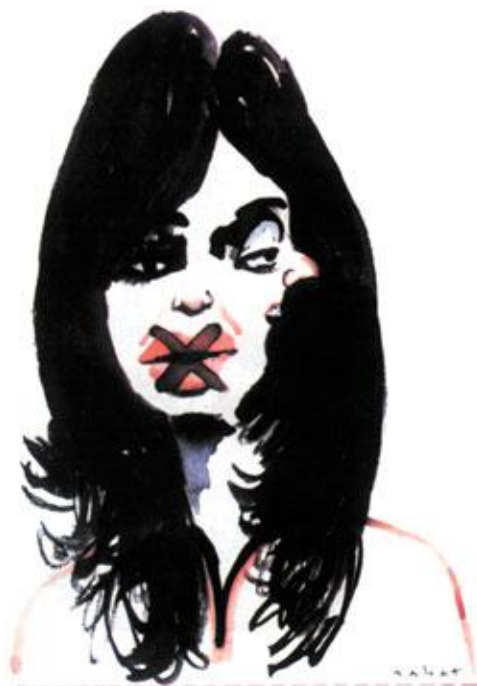
Imagen 3. Caricatura de Hemenegildo Sabat publicada por Clarín

La cobertura se mantuvo en niveles medios hasta la semana 14 (11/06/08 al 17/06/08). En ese lapso, hubo algunos picos asociados a hechos tales como la renuncia del ministro de Economía, Martín Loustean, la vuelta al paro del campo, el acto de asunción de Néstor Kirchner, ex presidente y esposo de la actual presidenta, como titular del Partido Justicialista (PJ) y la decisión de la Mesa de Enlace de seguir con el lock out pese al llamado al diálogo por parte del gobierno.