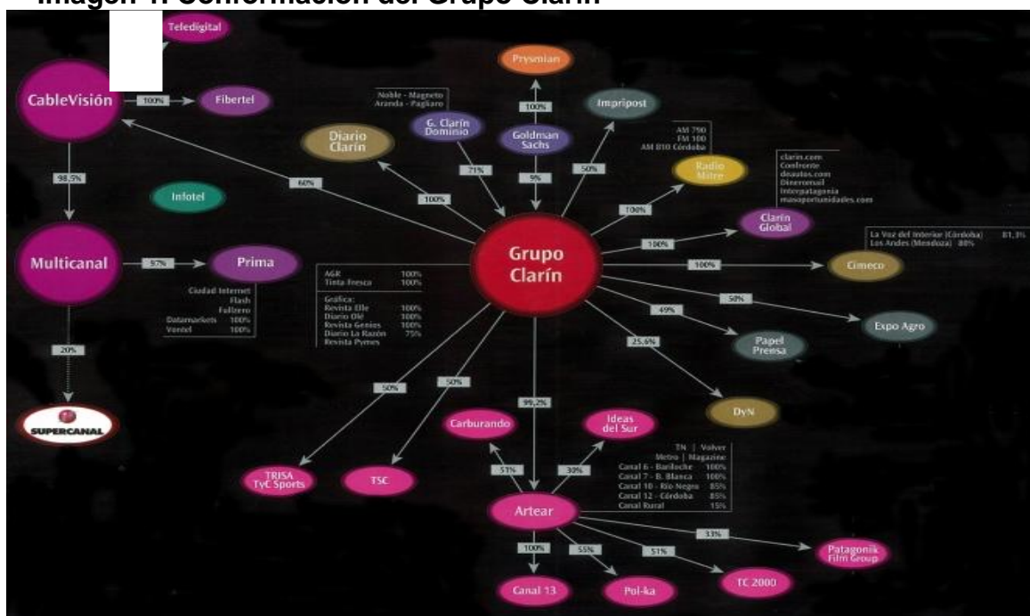
Imagen 1. Conformación del Grupo Clarín

constituirse en el más importante multimedio de capital nacional. Por otra parte, conjuntamente con el diario La Nación, Clarín es propietario de Expo Agro, la muestra anual más importante de maquinarias, insumos y productos del sector agropecuario del país.