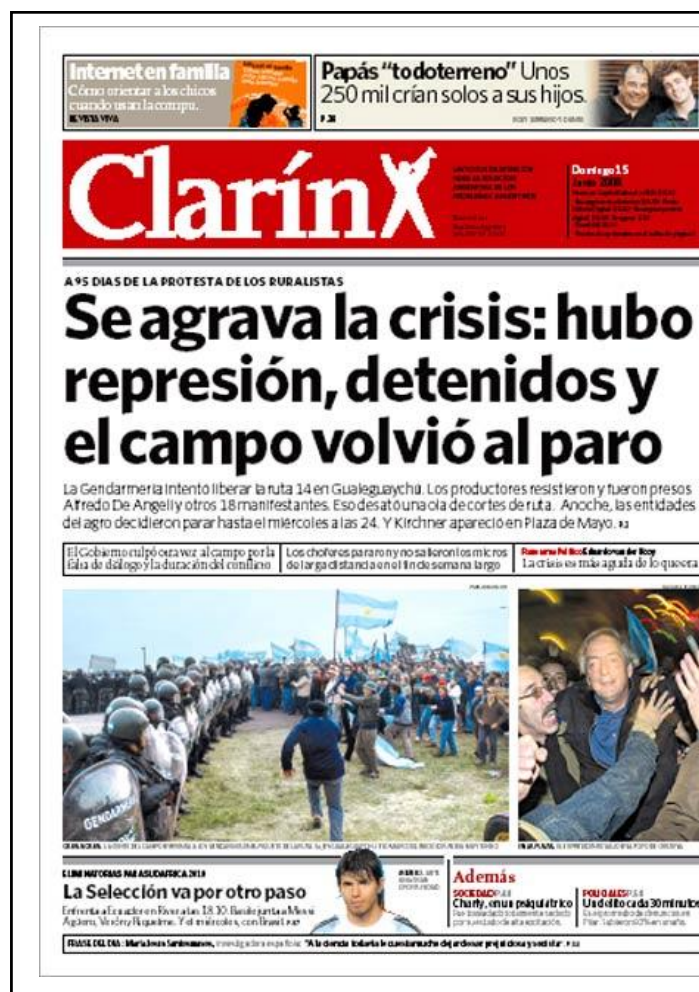
Imagen 4. Tapa de Clarín del 15 de junio de 2008

provincia y uno de los personajes de mayor repercusión mediática—, lo que derivó en nuevos cortes de rutas del campo 7 .