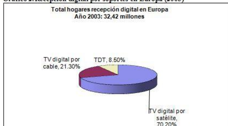
Gráfico 2. Recepción digital por soportes en Europa (2003)