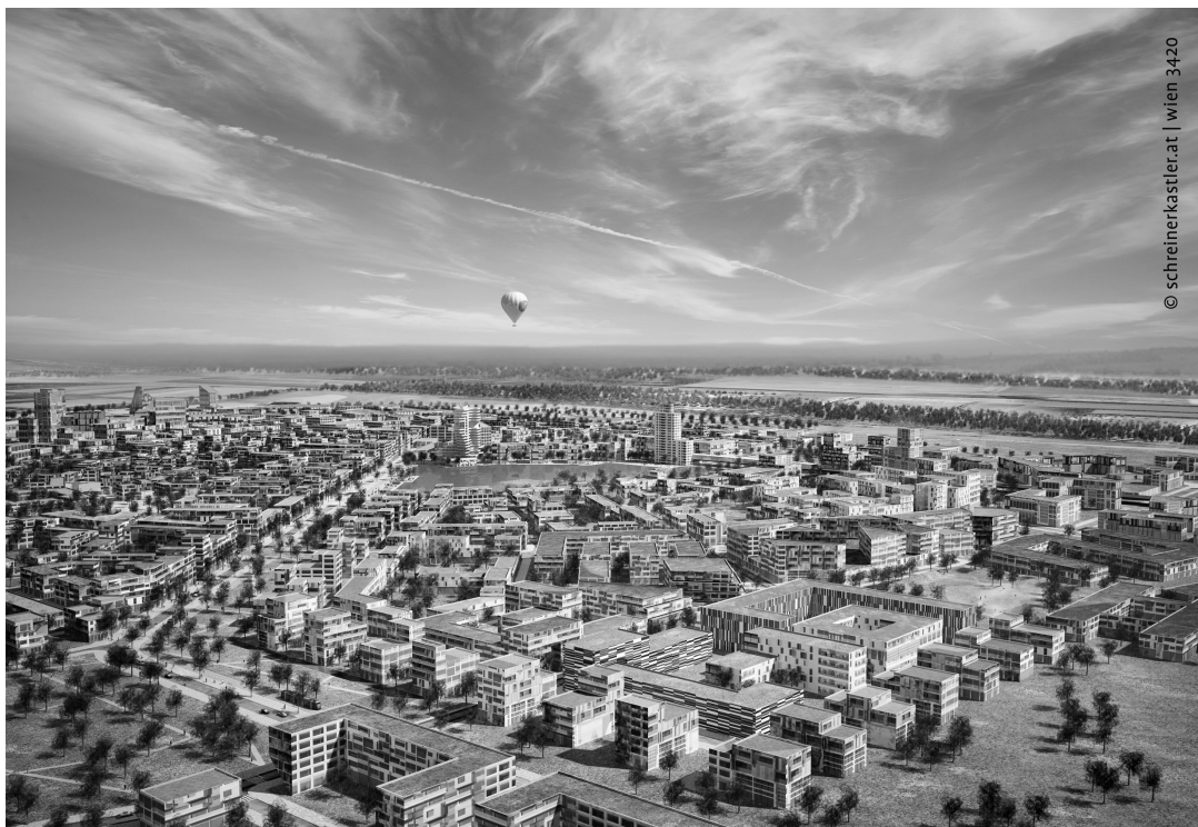
FIGURA 4. Visión urbanística (schreinerkastler 2012: < http://www.aspern-seestadt.at/presse >)

Este pretende ser un proyecto innovador con carácter de modelo. Finalmente, cabe preguntarse si cumplirá con estos requerimientos. Lo que se puede observar es que se perfila como una innovación ecológica y esto permite tener a priori una visión optimista.