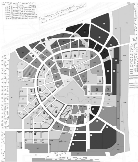
FIGURA 2. Plan regulador urbano de Tovatt Architects and Planners (Fiedler 2011, 6).

La Partitura presenta las visiones y los desafíos de cada una y define tipologías considerando distintas opciones de diseño más concretas para la primera fase de obra. Además, da directrices urbanísticas respecto a la jerarquía de las calles y de los espacios públicos, así como del diseño de la zona de planta baja y del mobiliario urbano.