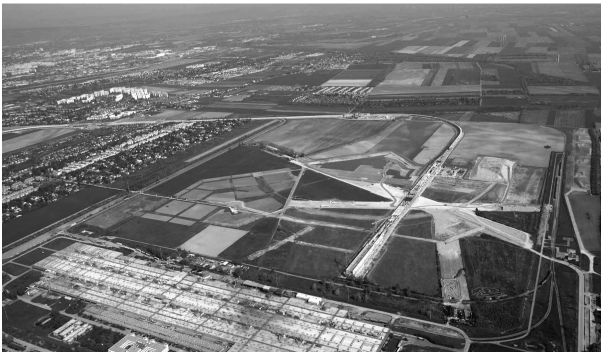
FIGURA 1. Imagen aérea del área de desarrollo urbano en Aspern (Fiedler 2011, 1)

1). En el StEP05 se fijó como objetivo para esta zona el desarrollo de un distrito de carácter urbano independiente, innovador y bien conectado a través del transporte público. La “Corporación Wien 3420 Aspern Development AG” (una empresa semiestatal) fue la encargada de iniciar y coordinar el proceso de desarrollo. En 2005 se realizó un concurso urbanístico en diálogo con los ciudadanos, lo cual llevó a que en 2007 se creara el Masterplan por parte del equipo sueco de Tovatt Architects and Planners. Con base en el Masterplan se implementó en 2008 una evaluación medioambiental determinando 63 criterios con respecto al medio ambiente, la sostenibilidad y la garantía de calidad para el proyecto de desarrollo urbano. Durante el mismo período se elaboró el branding de la Seestadt Aspern con el eslogan ‘Toda la vida’ refiriéndose a las dimensiones sociales e incluyendo aspectos de sostenibilidad.