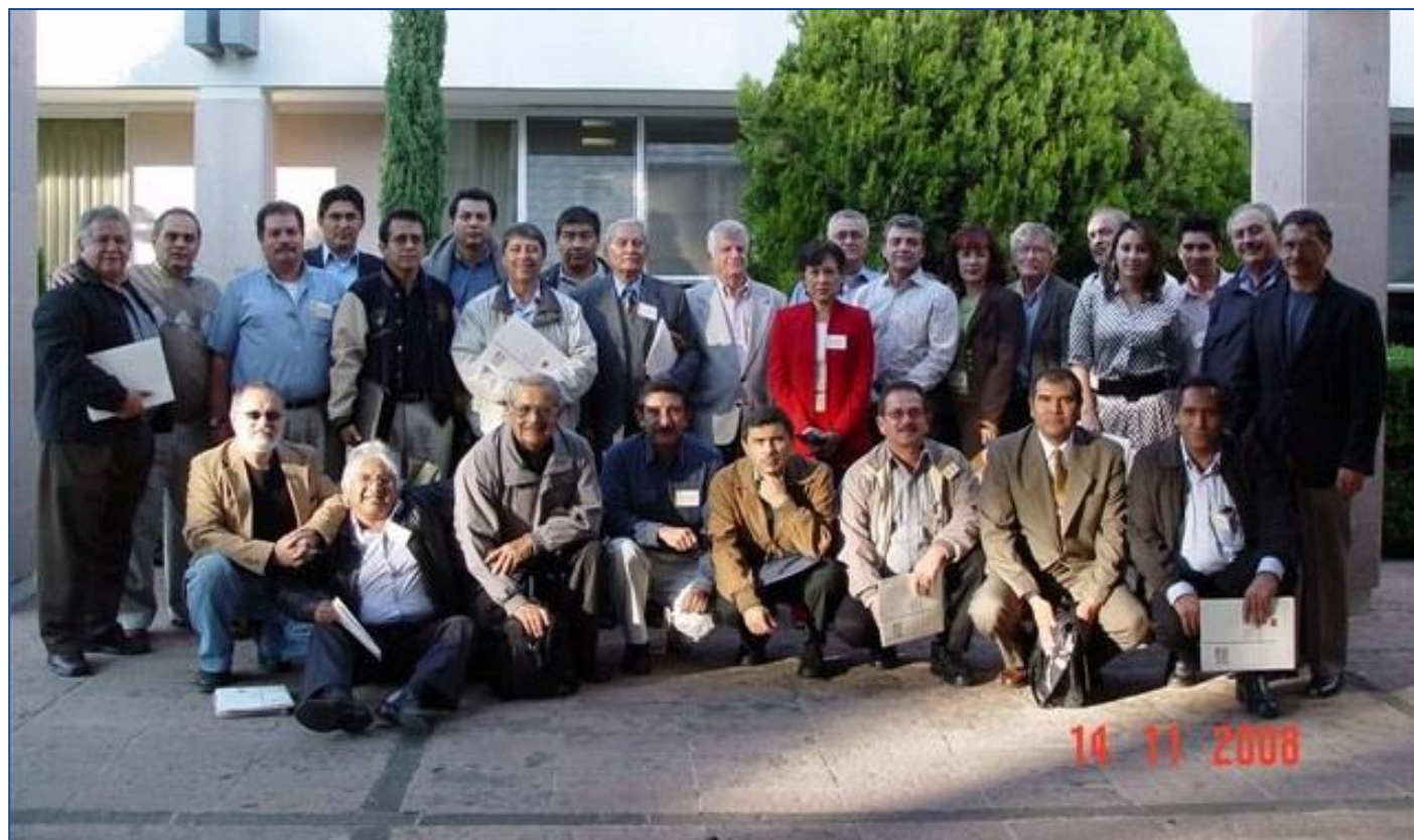
Asistentes al XVI Congreso Anual de la AGM