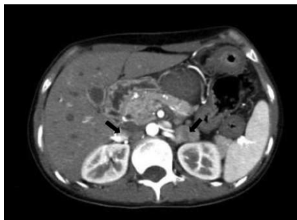
Figura 3 Tomografía espiral multicorte (TEM), que muestra la presencia de masas en ambas glándulas suprarrenales, compatibles con feocromocitoma bilateral.