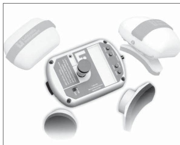
Figura 1 - Manual Muscle Test System

Realizados os procedimentos preliminares já descritos, passou-se a mensuração dos movimentos de extensão horizontal do ombro (EHO), abdução da articulação do ombro (AAO), flexão da coluna lombar (FCL), flexão do quadril (FQ) e abdução dos membros inferiores (AMI), através de um teste de esforço progressivo, onde cada