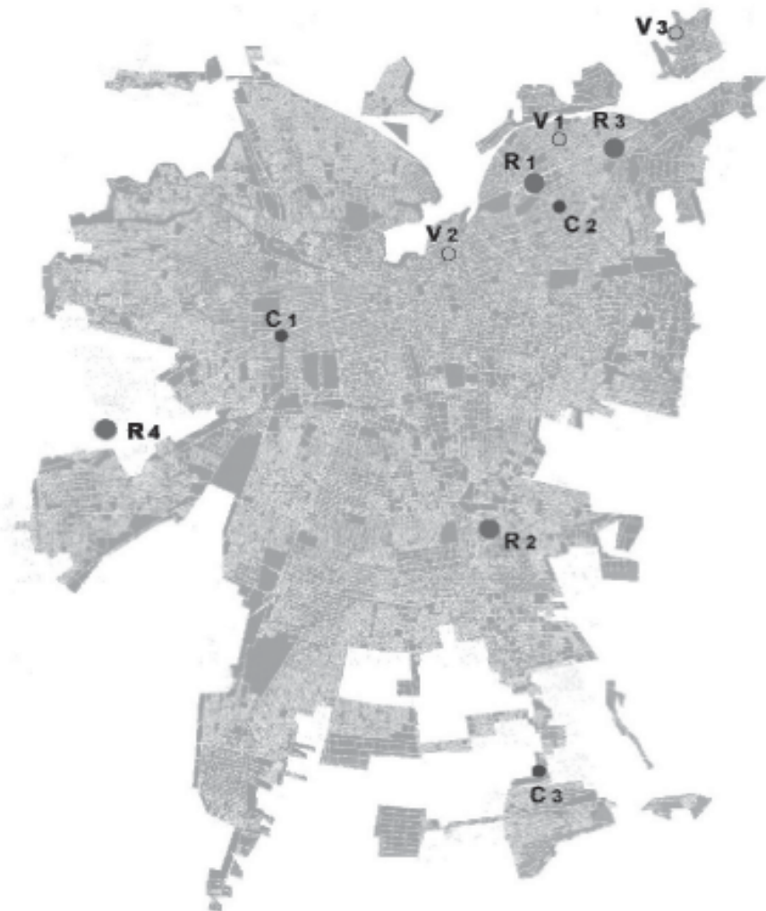
PLANO Nº 1: MALLES, POWER CENTERS Y CENTROS COMERCIALES, 1992

Códigos: R: regional C: comunal V: vecinal