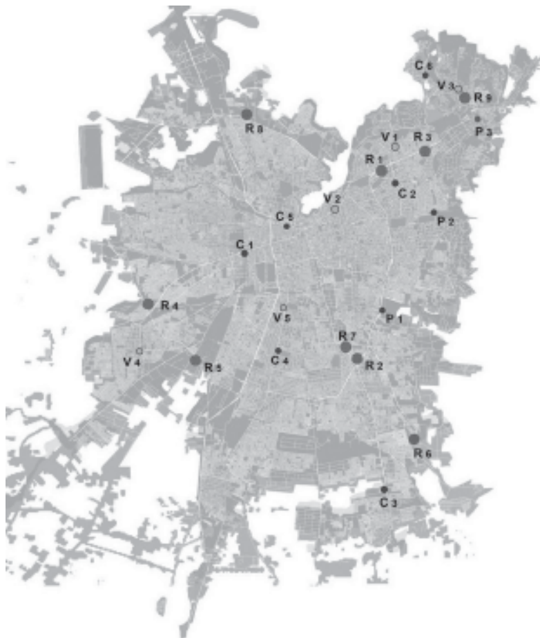
PLANO Nº 2: MALLES, POWER CENTERS Y CENTROS COMERCIALES, 2006