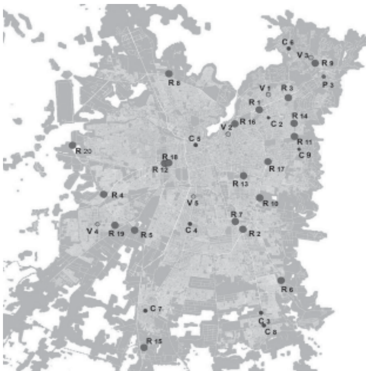
PLANO N° 3: MALLES EN 2012