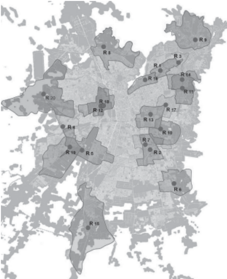
PLANO Nº 6: CURVAS DE ISOVALOR, 2015