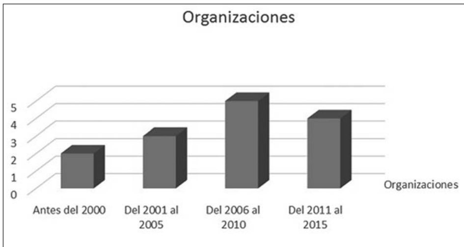
Gráfica 2. Creación de organizaciones por periodo.

Los procesos organizativos aluden a la conformación de grupos y organizaciones comunitarias de víctimas, de mujeres, de jóvenes, artísticas y culturales para la consecución de fines específicos. También dentro de esta clasificación se ubican aquellas acciones en las que existe articulación en torno a procesos de autoconstrucción o autosostenimiento, con o sin apoyo de organizaciones. La Comuna 3 tiene un amplio historial de procesos organizativos, entre los que resaltan la conformación de organizaciones como Comadres, Riobach, Asfadesfel, Antígonas y Aventureras (Taller FA, 6 de diciembre, 2014).