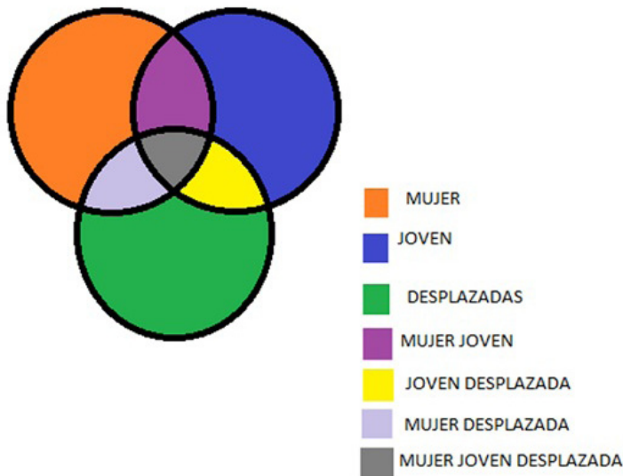
Gráfica 1. Diagrama simple de intersección.

Para comprender lo anterior resulta útil un diagrama simple de la intersección de mujeres jóvenes en situación de desplazamiento. Este se basa en la lógica de conjuntos, en donde la intersección se crea cuando un conjunto, para este caso «mujeres», contiene elementos del conjunto «jóvenes», y los dos anteriores comparten elementos con un tercer conjunto, «desplazadas». Es en estas uniones de los conjuntos donde se crean las intersecciones y se profundizan las exclusiones: