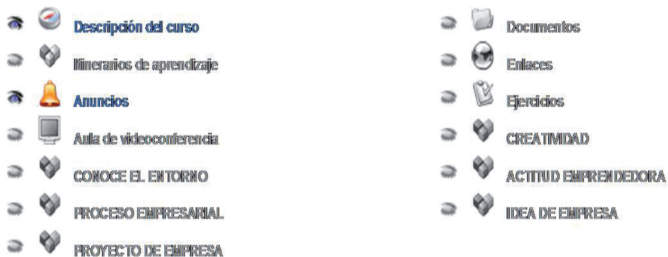
Gráfico A6. Recursos empleados