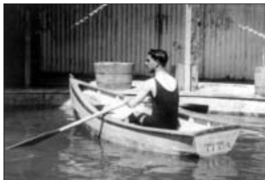
Figura 2. Hombre bogando en una pileta (Colección Museo Histórico Nacional).

Salvando esta trompe l’oeil , tal vez lo único que quede de este imaginario sea el concepto pampino de una estoica lucha por afianzar un territorio que ya no existe, un imaginario que se afianza y sostiene a cuenta de jirones y fragmentos de memoria,