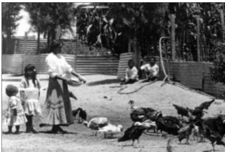
Figura 3. Mujer y pavos (Colección Museo Histórico Nacional).

Ciertamente, esto nos aparta bastante del imaginario “clásico” de lo que “debería ser” la “vida pampina”. Asimismo, otro eje significativo de ruptura con el pasado está dado por la incorporación de las variables ambientales, tanto a los procesos productivos como en todo aquello que afecte la vida del campamento.