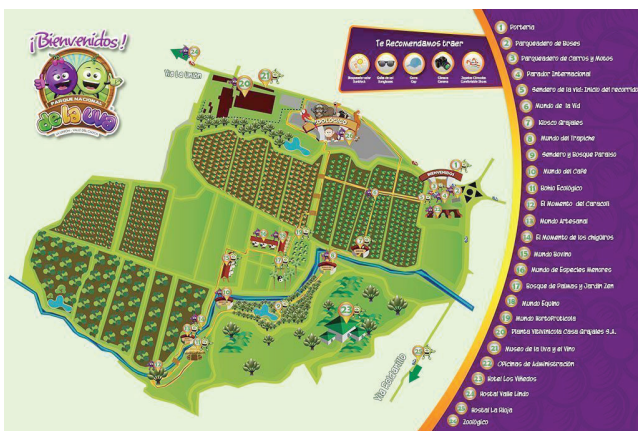
Figura 9. Plano del Parque Nacional de la Uva

Lo anterior potencia la cultura empresarial de la localidad por la preservación y aprovechamiento de su riqueza en flora y fauna, cuyo mayor potencial son frutas, verduras y hortalizas, viñedos, acompañados de especies menores. Continuando con la ventaja comparativa de las frutas, en el mes de octubre de cada año celebran el Festival de la Uva y el Vino, como escenario para reafirmar su riqueza natural con diferentes expresiones culturales, deportivas, recreativas y musicales.