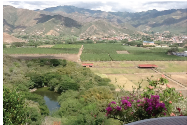
Figura 10. Cultivo de uva en La Unión .