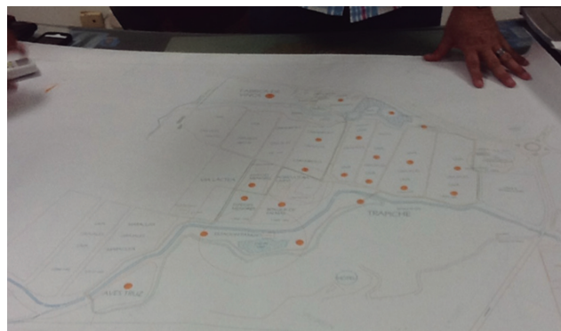
Figura 8. Plano del Parque de la Uva, Alcaldía del Municipio de La Unión

Este parque actualmente ofrece recorridos guiados y a pie por paquetes turísticos denominados el Pasaporte de la vid, el Pasaporte de la vid y el vino y el Pasaporte de la experiencia, esta última es una propuesta educativa por excelencia. En la Tabla 7 y la Figura 9 se presentan las diferentes propuestas turísticas que se realizan en torno al Parque de la Uva.