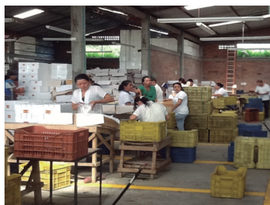
Figura 2. Empaque de la uva en la empresa Alberto Aristizábal Compañía.