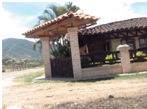
Figura 6. Vivienda esquinera, en las afueras del municipio de La Unión