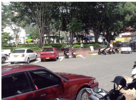
Figura 5. Parque Central en La Unión