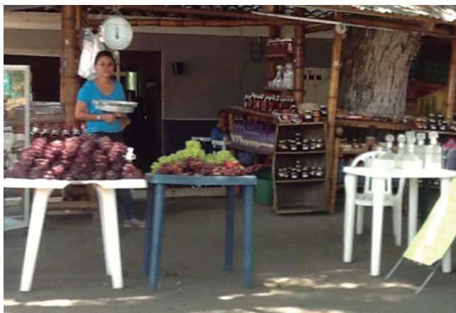
Figura 11. Comercialización en menor escala de productos de la uva

En gastronomía, sus pobladores conservan las recetas ancestrales y las producen en menor escala, siendo esta otra fuente de ingresos de las familias. Entre los productos gastronómicos más comercializados se encuentran: el sancocho de gallina en leña, el pandebono, el pandeyuca, las empanadas de cambray (son dulces), las empanadas de lechona (de sal), los bizcochuelos, la arepa y envueltos de choclo, los chiquichocos, los chorizos ahumados, la morcilla, la carne de res, cerdo o ternera ahumada. Se suma la variedad de dulces tradicionales: de guayaba, de papaya, el manjar blanco, de naranja agria, las cocadas, de grosellas, de yuca, la mermelada de guayaba, entre otros. En cuanto a bebidas, además del vino, se cuenta con dos muy exóticas y con propiedades afrodisíacas: el trabuco y el polvorete, siendo muy reconocidos por los habitantes del norte del Valle del Cauca.