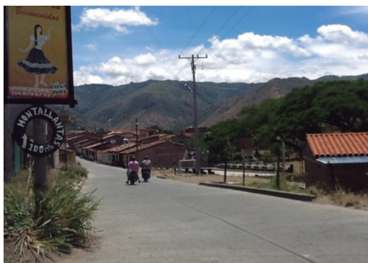
Figura 7. Vía que comunica al corregimiento de San Luis, en La Unión

Para la actual administración se prevé el respaldo a nueve planes habitacionales expresados en la construcción de viviendas denominadas urbanizaciones: Villa Nueva, El Rosario, La Flora, San Miguel (Los Hateños), Vendimi, La Ermita, El Prado, Portal de La Andina y Villa del Sol.