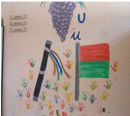
Figura 4. Iconografía en educación propia. Resguardo Cerro Tijeras.

En este marco se ubica la iconografía propia, como la construcción simbólica de los héroes, de la historia, de los referentes identitarios de la constitución de la cultura indígena como expresión del discurso pedagógico que apoya la construcción del Sistema Educativo Indígena Propio. (Ver Figura 4).