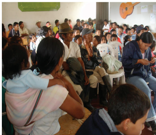
Figura 2. Asamblea Comunitaria. Cabildo de Pueblo Nuevo, Ceral.

decisión “las Asambleas Comunitarias” como espacios de deliberación colectiva. (Ver Figura 2)