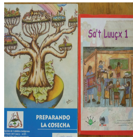
Figura 1. Material didáctico del Proyecto Educativo Comunitario (PEC).

Durante los años noventa se impulsa la construcción de los Proyectos Educativos Comunitarios (PECs) 13 , se elaboraron materiales educativos bilingües (Ver Figura 1.) impulsando la promoción de experiencias educativas a partir de centros experimentales comunitarios de educación bilingüe (CE-CIBS), se diseñan las áreas del currículo propio y se impulsa, con mayor vigor, la investigación y la capacitación de maestros indígenas (CRIC, 2004).