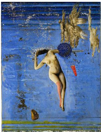
Fig. nº3 Max Ernst (Imagen sin texto)

Tal como hemos planteado en este artículo, estudiaremos la importancia del texto que aparece acompañando a una imagen con el propósito de dar una explicación a la representación, paratexto si se nos permite la concesión, que en este caso Max Ernst acompaña a la pintura que lleva por título, .Fig. nº 4. Max Ernst. "La puberté proche ou Les Pléiades" (1921) Collage de fotografía, gouache y oleo sobre papel. (24,5x16,5cm).