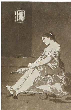
Fig. nº 1 Estampa de Goya (Imagen sin texto)

Comentamos a continuación la inclusión del texto así como la importancia que éste asume en la estampa nº 32, "Por que fue sensible". Analizamos la lectura de la misma en primer lugar sin el paratexto que la acompaña y posteriormente, con la información que aporta el mismo.