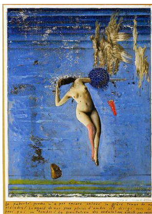
Fig. nº 4 Max Ernst "La puberté proche ou les Pléiades" (1921) Técnica mixta (24,5x16,5)cm.