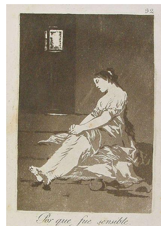
Fig. nº 2 Goya "Por que fue sensible" (1792) Aguafuerte (21,8 x 15,2) cm.