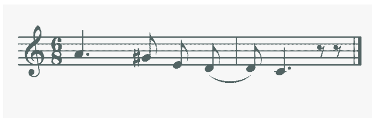
Figura 1. Versión simplificada del gesto melódico cadencial \hat{7}^{\wedge}5^{\wedge}4^{\wedge}3 en La menor

Género. En la colección aparecen 20 bambucos, 5 pasillos, un torbellino y una canción. Para efectos del análisis cuantitativo, los bambucos recibirán el valor de uno (1), y cualquiera de los otros géneros, el valor de cero (0).