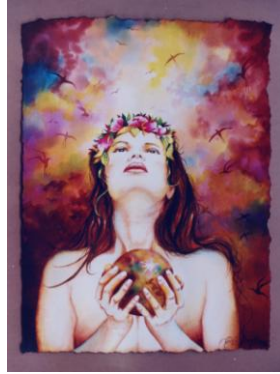
Imagen 2. “ Mi universo ”. Técnica: Acuarela. Medidas: 40 X 30 cm.