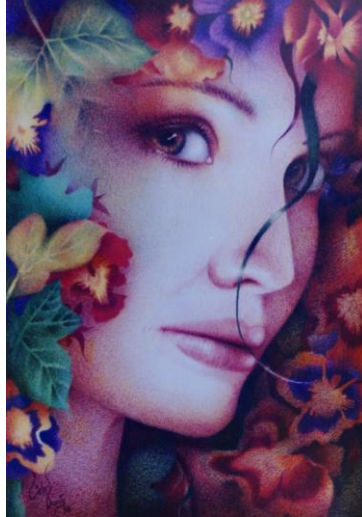
Imagen 1. "Pensándote". Técnica: Lápiz Graso. Medidas: 34 X 24 cm