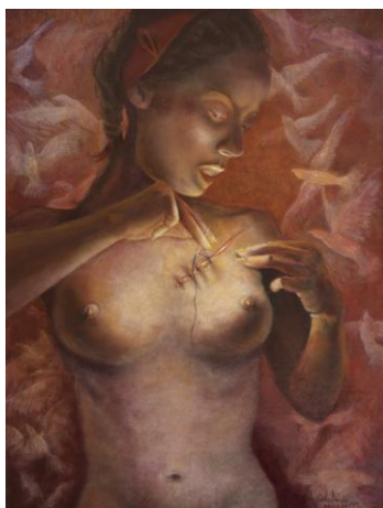
6. "Zurcidora de mi propia vida". Técnica: Temple a la barniceta y óleo sobre lino/madera. 40 X 30 cm

Este análisis lo desee realizar no tanto para darle un enfoque académico, que la obra de Cielo lo tiene, lo realicé con la intención de estudiar el concepto que para mí punto de vista es más importante porque el concepto es concebir, es estar preñado por el espíritu a la hora de imaginar la obra, es entregarse y recrearse donde antes existía la nada. Es proporcionarle existencia a lo que antes no significaba y que nos permite a los otros también recrearnos e inspirarnos para comulgar con el artista como ahora lo hago con Cielo Donís. Agudizar los sentidos para decodificar todos aquellos símbolos que manifiesta el creador/a y que también estimulan los nuestros. El lenguaje debe de ser vivido para que los demás ingresemos a ese mundo. Cielo habita en su pintura, esto es lo significativo de tratar este tema. El artífice no nos muestra la verdad sino su verdad. Al igual que el educador transmite, comunica, guía... inspira.