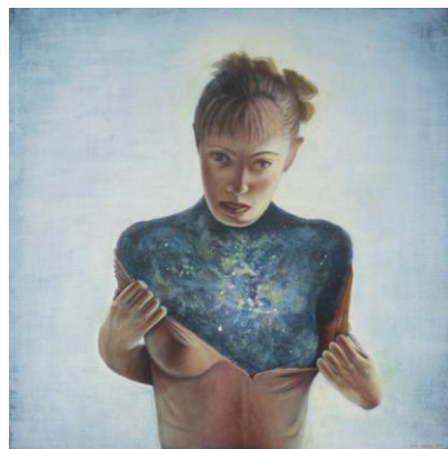
5. " Yo universo ". Técnica. Temple a la barniceta y óleo sobre madera/madera. Medidas 80 X 80 cm

Todos llevamos el universo dentro y lo concebimos de manera muy personal, el ADN que todos llevamos intrínsecamente es un alfabeto que nos une a una biblioteca universal que es el mismo cosmos en donde tus palabras, mis palabras, sus palabras y aquellas palabras son nuestras palabras. Historias que se entretajan para bordar el gran vestido donde todo sucedió, todo está sucediendo y todo está por suceder.