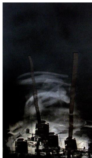
Figuras 4 y 5. Serie Obra negra. Xilografía, dibujo y electrografía sobre papel negro de algodón. 65x110 cm. 2007-2008.