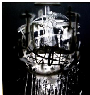
Figuras 8 y 9. A la izquierda fotografía sin intervenir y a la derecha fotografía intervenida

Para conservar la placa utiliza goma laca y a continuación le da un leve lijado para suavizar la superficie.