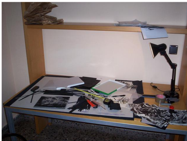
Figura 7. Fotografía de su mesa de trabajo en pleno proceso de creación

El proceso de fusión lo realiza transfiriendo en primer lugar la imagen en el papel de algodón y posteriormente imprimiendo encima la madera tallada.