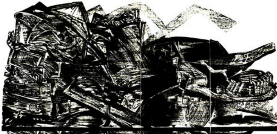
Figura 6. "El instante. Xilografía. 1992

Actualmente Pérez Cruz está trabajando con video 9 y con música intentando crear no únicamente las expectativas visuales, sino también las sonoras, de manera que el espectador se vea atrapado por el sonido cotidiano y a veces rebuscado de algún tema en particular.