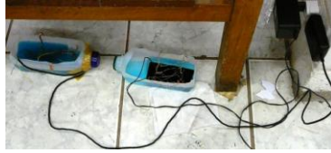
Figura 3. Sistemas para grabado electrolítico, empleando transformadores de teléfono celular y placas de cobre. Nótese que el receptor se ha reducido a una trama de alambres de cobre.