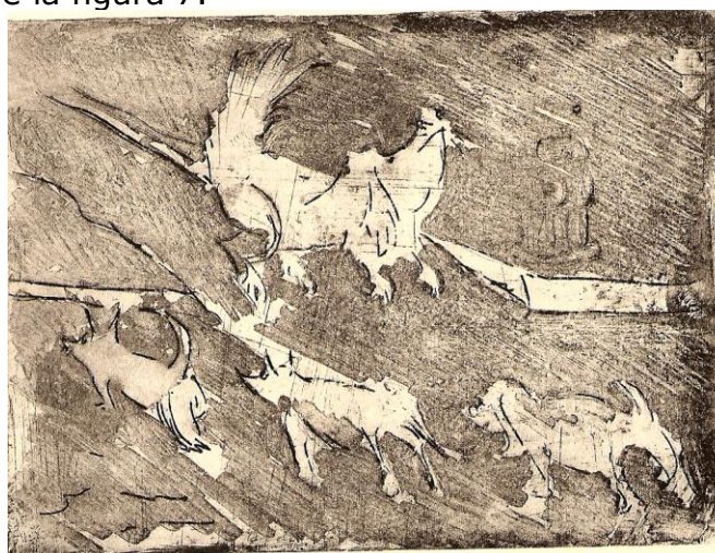
Figura 7: "Tres perros de la calle y una perra de avenida" P/E 2009, Francisco Hernández. Grabado en placa de bronce quemada con mordente de sulfato salino.

En el caso de láminas de bronce la "mordida" es delicada, no obstante, permite trabajar tanto en aguafuerte como en aguainta, como se muestra en el grabado de la figura 7.