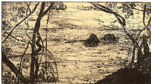
Figura 1: "Desde lo alto de la montaña" 1/25 Francisco Hernández, 2009. Aguafuerte y aguatinta, realizado en una placa de aluminio, quemada con el mordiente de sulfato salino. Las manchas tonales se realizaron con trazos de lápiz de cera y subsecuente difuminado con un pincel impregnado en varsol.

Podemos hacer una breve sinopsis de algunos problemas médicos asociados con sustancias empleadas tradicionalmente en el grabado, para enfatizar en la necesidad de hacer cambios en pos de una mayor bioseguridad. Por ejemplo, solventes como el varsol y el espíritu mineral, son mezclas de hidrocarburos livianos, algunos de los cuales se involucran con cáncer de pulmón, riñón, nasofaringe, leucemias, otros problemas renales a parte del cáncer y en mujeres embarazadas puede inducir malformaciones fetales. La resina de colofonía es una mezcla compleja de resinas aceitosas, la mayoría de carácter ácido y se obtiene por destilación de óleo-resinas de pino; se le asocia con problemas de asma bronquial y dermatitis. Sin embargo, para ambos casos hay sustitutos interesantes; así, los solventes orgánicos se pueden remplazar en gran medida por aceite de cocina o por la manteca vegetal, tanto para adelgazar la tinta como para limpiarla. En el caso de la resina de colofonía utilizada para crear los tonos y ambientes del aguatinta, se puede sustituir por pintura en aerosol, o bien, con un lápiz de cera se pueden lograr efectos interesantes, que se traducen en valores tonales y atmósferas atractivas, como se puede apreciar en el grabado de la figura 1.