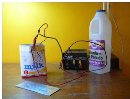
Figura 5. Sistema de grabado electrolítico en placa de aluminio, empleando alumbre (KAl SO 4 ) como electrolito, en un recipiente tetrabrik y usando papel de aluminio como receptor. Sobre la mesa hay otra placa de aluminio quemada previamente con este método.

En el otro caso, se utilizó alumbre (sulfato de aluminio) como electrolito, pues se trabajó con placas de aluminio y el receptor fue una hoja de papel de aluminio, de los utilizados en la cocina y tiene la ventaja de poder amoldarse fácilmente a la bandeja de trabajo y una vez quemada la placa, se puede limpiar el papel de aluminio para reutilizarlo; obviamente, los materiales receptores se conectan al electrodo negativo y las placas de grabado al positivo o ánodo, recordemos que el método también se denomina grabado anódico.