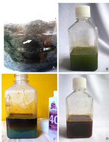
Figura 6: Preparación del cloruro férrico. A) Lana de hierro en un recipiente plástico con ácido muriático, observe las burbujas señaladas por la flecha. B) El proceso de oxidación del hierro se ha completado, el líquido ha adquirido una coloración verdosa. C) Al adicionar agua oxigenada a la solución anterior, se oxida aún más el hierro y la coloración va cambiando a parda, como se observa en la superficie del líquido. D) Proceso totalmente finalizado, observe como el color de la solución cambió a pardo.

En la figura 6, se muestra el proceso descrito, y es importante observar los colores de la solución en cada paso, pues nos indican el proceso que ha ocurrido. Es ideal concentrar la solución por evaporación, dejando que su volumen se reduzca al menos un tercio del original, para que el líquido se torne más denso y de color pardo intenso; en este punto su densidad es de ca. 42° Baumé, que es lo recomendado para una mayor efectividad. Es preciso tener algunos cuidados en esta preparación, pues se trabaja con HCl; por ello, debemos utilizar gafas de seguridad y guantes de hule para manejar esta sustancia; también, el frasco donde se coloca el HCl debe ser plástico y se debe dejar la tapa ligeramente abierta para que escape el gas liberado durante la oxidación del hierro, si se tapara herméticamente, la presión en el interior, aumentada por el gas atrapado, podría lanzar la tapa o romper el frasco; obviamente, este frasco debe rotularse indicando que es peligroso y debe colocarse en un sitio bien ventilado y aislado, donde no implique ningún riesgo.