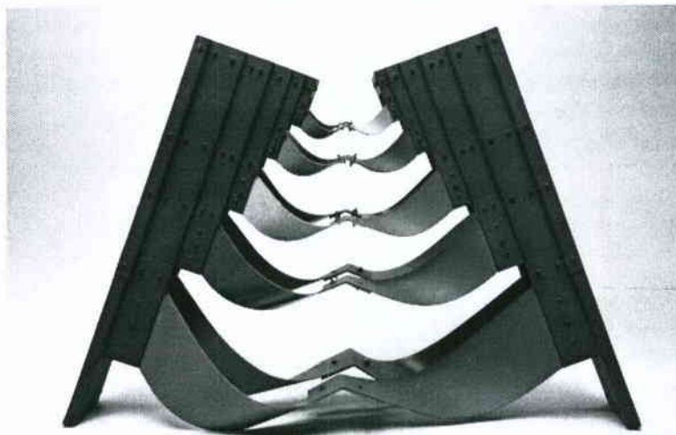
Edgar Negret, Fiesta andina, Aluminio pintado, 97.5X143X65 cm, 1992