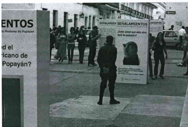
Exposición frente al Banco de la República, nov/15/2007

Un trabajo de investigación siempre pasa por distintas etapas que tienen que ver con el desarrollo de una motivación inicial, pero que no necesariamente se pueden planear y ejecutar a partir de un orden establecido. En ese sentido el trabajo de investigación, relacionado en este caso con la curaduría del museo, es muy cercano al trabajo de creación que se realiza en el campo del arte propiamente dicho: está relacionado con la voluntad de plantearse un problema -una pregunta- adoptar una posición, y construir en torno a ello distintas aproximaciones, acercándose al objeto de estudio pero también tomando distancia. Los resultados, a veces pueden ser inesperados, como fue este caso. Se había propuesto desde el comienzo una actividad de exhibición de las obras, esta parte del trabajo inicialmente se planeó como un ejercicio para poner a dialogar algunas piezas de la colección, haciendo ciertos cambios, trasladando determinadas obras de un lugar a otro del museo para generar ciertos diálogos entre ellas. La exposición se llamaba "Señalamientos", porque trataba justamente de indicar, sugerir, encontrar lecturas sobre la obras para propiciar nuevos encuentros de la colección con el público.