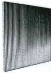
Carlos Cruz Diez