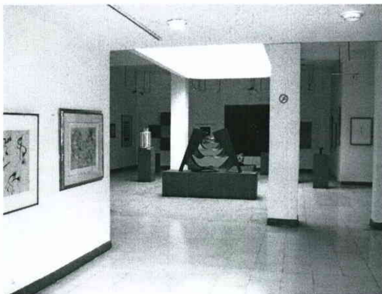
Vista general del Museo Iberoamericano de Arte Moderno de Popayán

El Museo Iberoamericano de Arte Moderno de Popayán fue fundado en el año 1994, en unas instalaciones adyacentes a la Casa Museo donde se conserva la obra del maestro Edgar Negret desde 1984. En la Casa Museo se encuentra un recorrido por diversos periodos de la obra de Negret y además se conservan algunos objetos, entre ellos muebles, fotografías, piezas precolombinas y libros. El Museo Iberoamericano de Arte Moderno cuenta con una colección de obras de artistas destacados de Argentina, Brasil, Venezuela, Perú, México, España y Colombia.