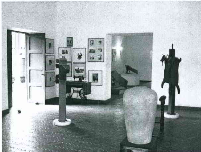
Vista general de la Casa Museo Negret, Popayán

que están representados y además dificulta identificar criterios sobre la conformación de la colección.