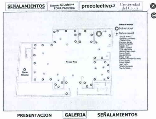
Vista parcial de la Multimedia sobre el MIAMP

Las fuentes primarias de la investigación son las obras que hacen parte de la colección del museo. Si se tiene en cuenta su carácter heterogéneo se puede entender la dificultad que existe al abordar un trabajo de reflexión que implica su estudio, su conocimiento con el fin de desarrollar el trabajo curatorial. Si a esta dificultad se suma la ausencia de documentación sobre la procedencia de las obras e incluso sobre sus datos técnicos se puede entender el cambio que tuvo el proyecto en su esencia.