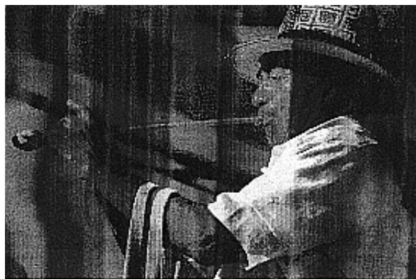
Indígena Wayuú interpretando El Ontorroyoi