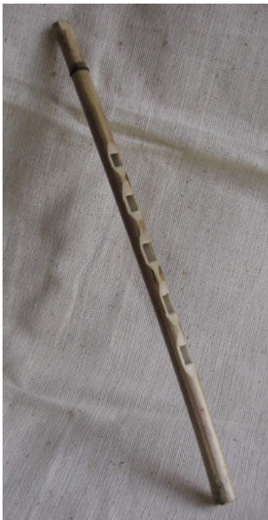
El Sahuahua. Colección de Instrumentos Musicales Wayuú, Propiedad de la Investigadora