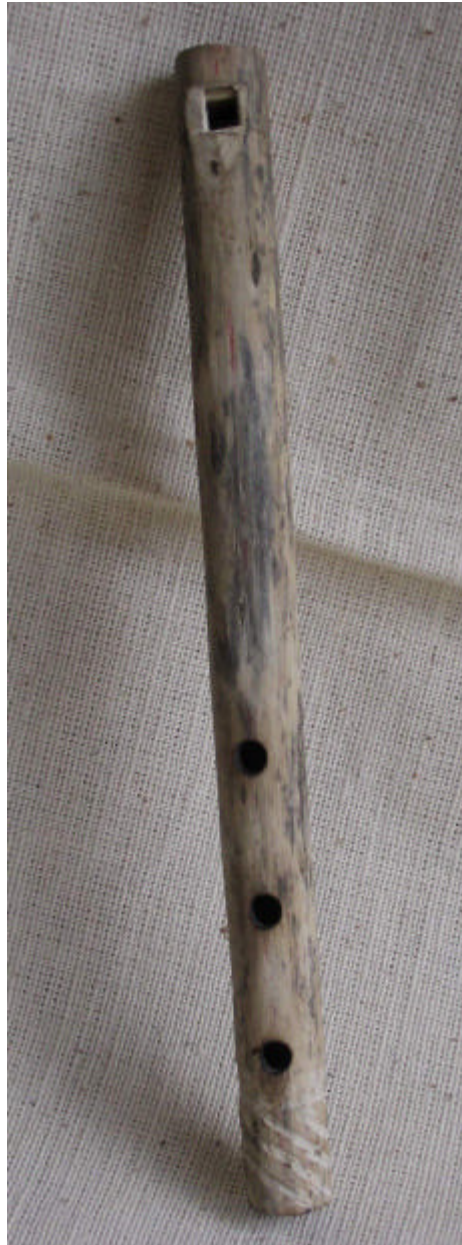
El massi. Colección de Instrumentos Musicales Wayúú, Propiedad de la Investigadora

Forma de Ejecutar el Maasi: Se coloca el extremo del orificio del instrumento (La embocadura) entre los labios sin presionar y se sopla.