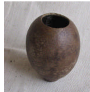
El Ontorroyoi: Colección de Instrumentos Musicales Wayuú, Propiedad de la Investigadora