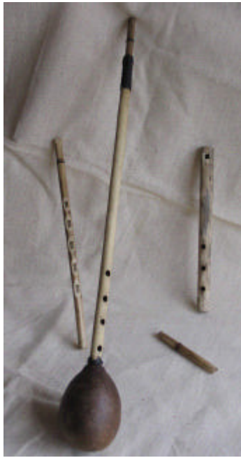
Colección de instrumentos Wayúú 1 Propiedad de la Investigadora

Maitre de Conférences. Guilles LEOTHAUD. Ufr Ethnomusicologie Sorbonne Paris IV, FRANCE