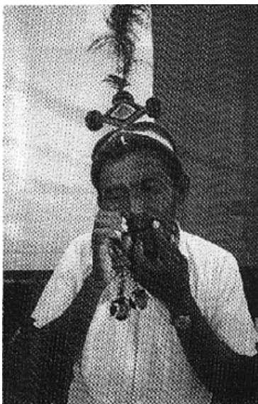
Indígena Wayú interpretando la turrompa

Por otra parte, Londoño no comparte la clasificación que le asigna el Maestro Abadía a la turrompa como "Aerófono Libre", puesto que la materia que está vibrando es el cuerpo mismo del instrumento y no el aire ( El lector debe referirse al ANEXO 1. Cuadros de Clasificación de algunos instrumentos ). Sin embargo hay que tener en cuenta que el mecanismo utilizado en el plano acústico es el siguiente: Labios+conducto faringe bucal + estímulo interno -externo(el aire) 17 .