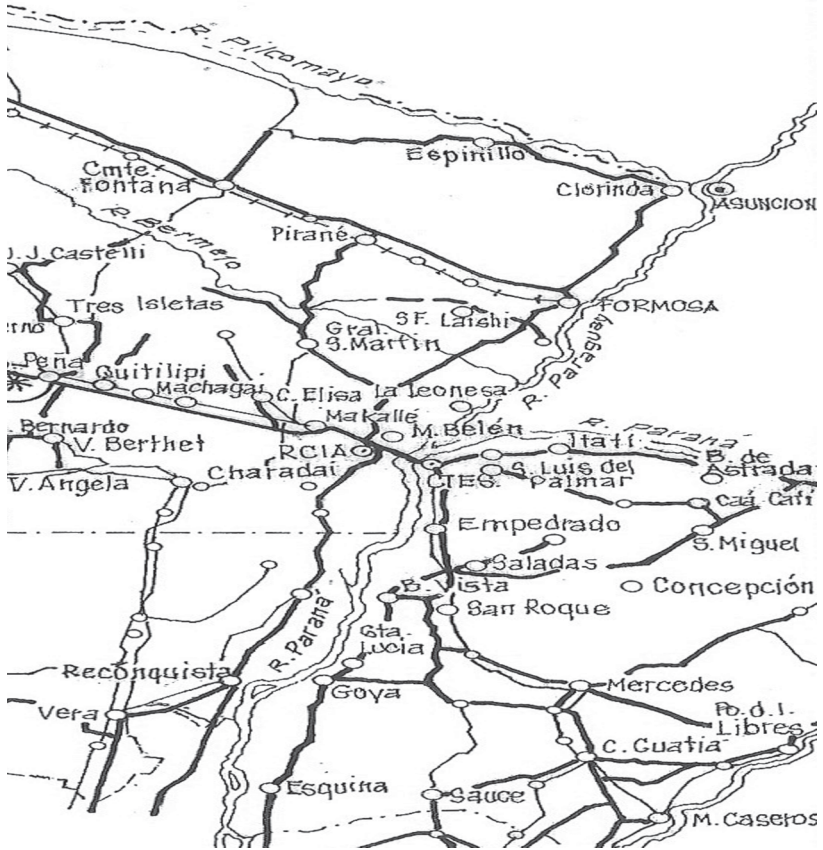
Figura II Provincia del Chaco, Argentina

Fuente: Elaboración propia con base en Mapa de la Provincia del Chaco, Instituto Geográfico Militar. Disponible en: http://www.igm.gov.ar/node/105 . Fecha de consulta 10 de agosto de 2007.