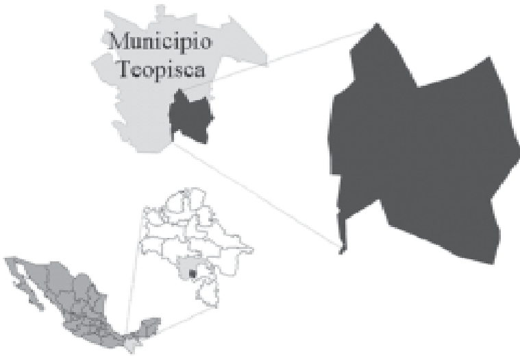
Figura 1 Localización Región Altos de Chiapas