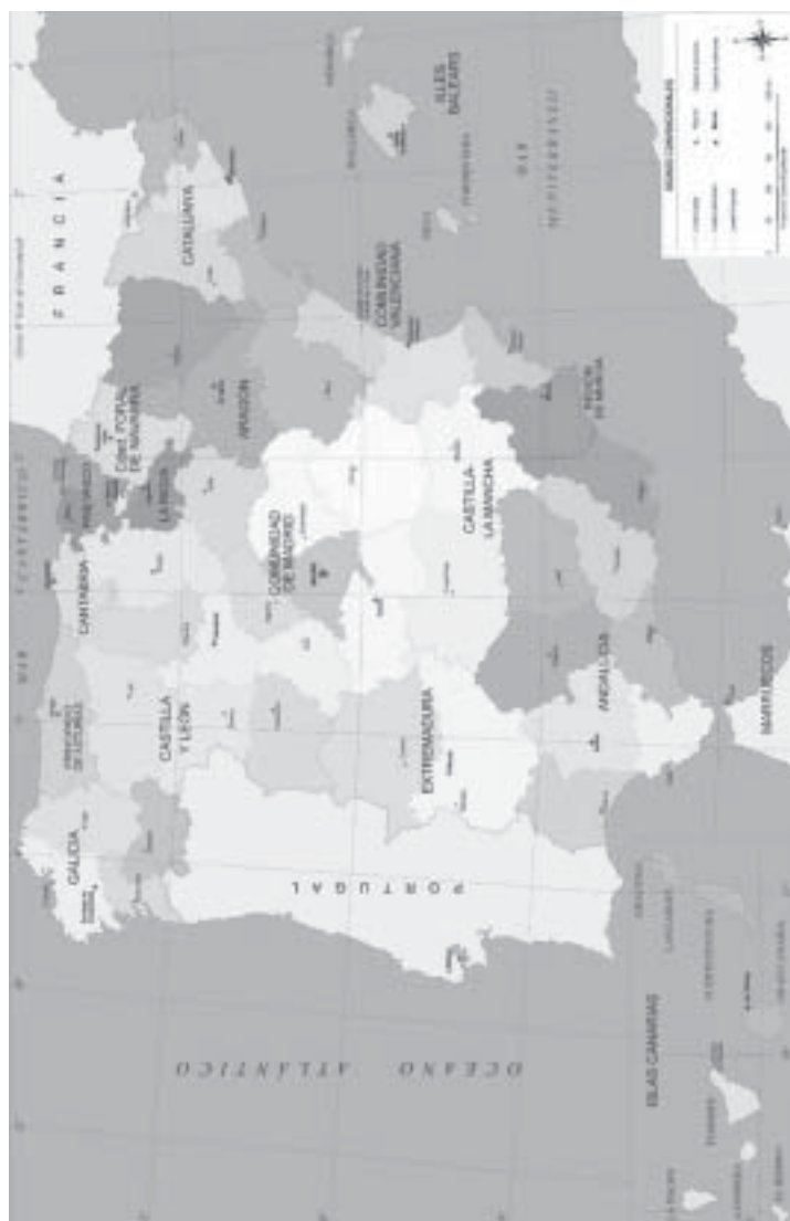
Mapa 1 Las regiones españolas