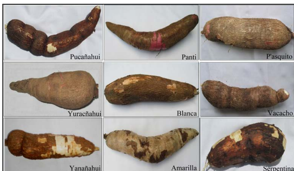
Figura 1. Cultivares de yuca en la sub cuenca de Santa Teresa

mejor las características productivas de los cultivares, expresadas en sus rendimientos potenciales.