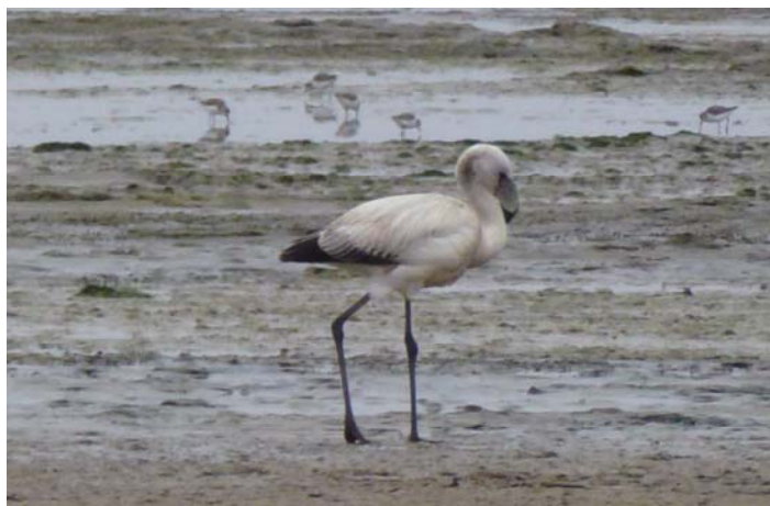
Figura 3. Individuo juvenil de P. jamesi en la playa La Aguada, RNP – Julio 2012. Se puede apreciar el plumaje más apagado, además de la carencia del cuarto dedo en las patas.

Estos resultados confirmarían el movimiento migratorio de esta especie entre las zonas de reproducción y alimentación (Caziani et al. , 2007); ya que se reproduce en verano en las lagunas altoandinas, y en invierno muchos individuos se desplazan hacia los humedales de menor altitud en las llanuras centrales de Argentina y la costa peruana (Parada et al. , 1990). Estos individuos podrían provenir de la Laguna Colorada en Bolivia, ya que es la zona reproductiva con la mayor colonia de P. jamesi (Valqui et al. , 2000) y la más cercana a la costa peruana.