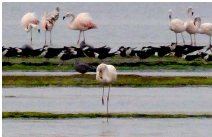
Figura 2. Individuo adulto de P. jamesi en Playa La Aguada, RNP - Julio 2012. Se aprecia el característico pico triangular con el primer tercio del pico de color negro, tarsos de color rojo. Al fondo, individuos de Phoenicopterus chilensis .

La playa La Aguada es una zona comprendida desde la orilla de mar hasta la carretera al Puerto San Martín; limita al Este con la zona de recuperación de Santo Domingo y al Oeste con la zona de protección estricta de la Bahía de Paracas. Está considerada como Zona Silvestre, es decir es un área que ha sufrido poca o nula intervención humana, en la que predomina el carácter silvestre, es posible realizar actividades de investigación científica, educación y