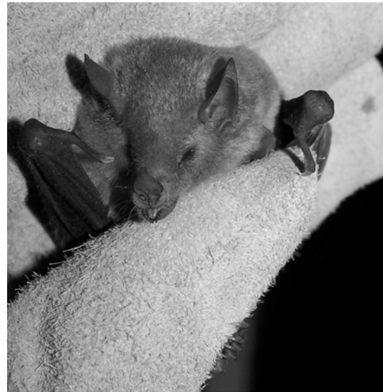
Figura 3. Glossophaga soricina (Pallas 1766)

Ambas especies han sido mencionadas como presentes en el Departamento de Ica. La especie G. soricina fue registrada en construcciones urbanas, huertos de árboles frutales y en la vegetación del monte ribereño. Mientras que M. atacamensis fue encontrada en la vegetación de huertos, chacras y entre el follaje de árboles y arbustos (Hernandez-Ríos & Velásquez, 1998).