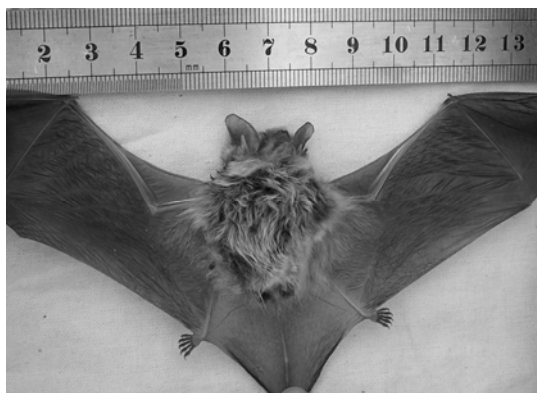
Figura 2. Myotis atacamensis (Lataste 1957)

Se capturaron un total de 4 individuos, los cuales corresponden a dos especies. Tres especímenes resultaron ser Glossophaga soricina (Pallas 1766) (Phyllostomidae) y uno Myotis atacamensis (Lataste 1957) (Vespertilionidae). No se produjeron recapturas (Figuras 2 y 3).