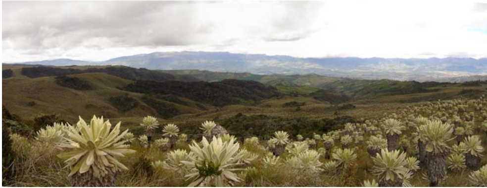
Figura 1. Fotografía de los remanentes de bosque siempre verde montano alto.

esta zona es un mosaico de formaciones vegetales: páramo de frailejones, humedales y bosque siempre verde montano alto (Figura 1). Entre las especies dominantes del dosel del bosque se encuentran: Weinmannia sps., ( Hedyosmum cumbalense H. Karst. y Miconia tinifolia Naudin, entre otras. Mientras el páramo esta dominado por frailejones ( Espeletia pycnophylla Cuatrec) y gramíneas de los géneros Agrostis y Calamagrostis .