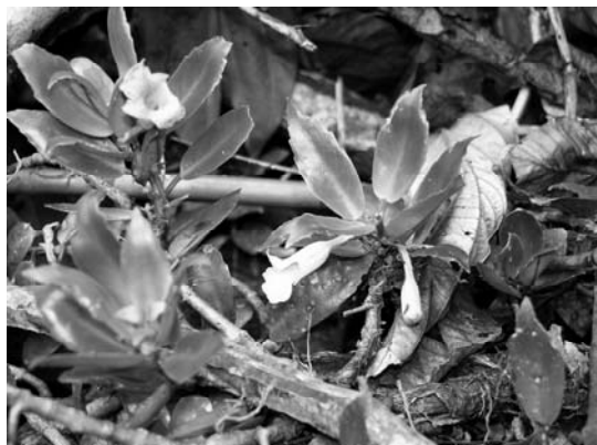
Figura 5: Codonanthe uleana Fritsch en hábitat.

Para su cultivo es recomendable mantener a la planta siempre en lugar abrigado para garantizar su crecimiento (Figura 6). Justamente gracias a esto fue posible notar que los dos morfotipos descritos en el párrafo anterior eran de la misma especie.