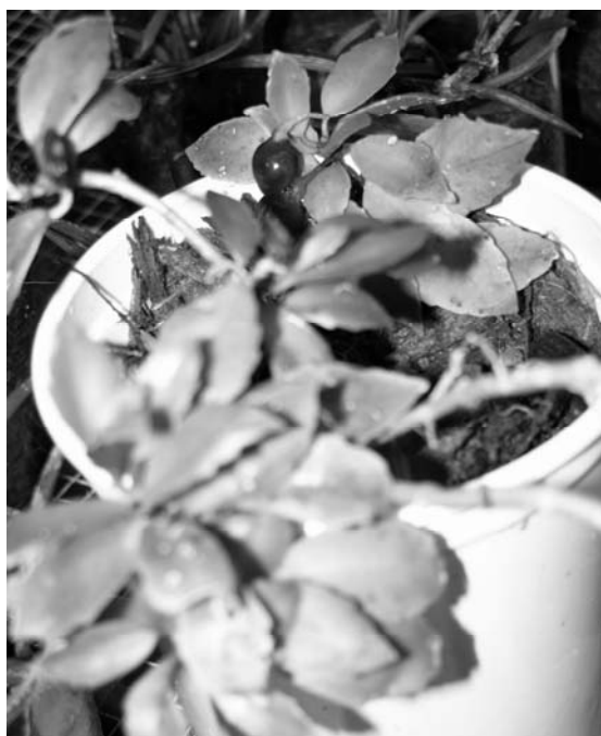
Figura 6: Codonanthe uleana Fritsch en cultivo.