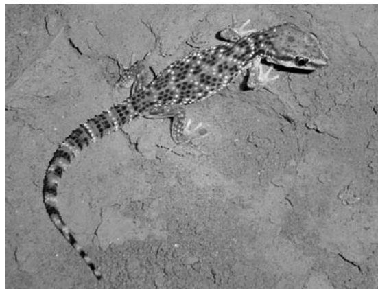
Figura 1. Ejemplar adulto de Phyllodactylus sentosus fotografiado en la Zona Arqueológica de Pachacamac.

establecidos dentro de los sitios arqueológicos, detectando a los animales allí presentes. Cuando la búsqueda nocturna no fue posible, se realizó una búsqueda diurna levantando escombros, sin dañar los restos arqueológicos. Los animales encontrados fueron identificados siguiendo las descripciones dadas por Dixon & Huey (1970). Los lugares de distribución conocidos para P. sentosus , incluyendo los nuevos registros, se muestran en la Figura 2 y se listan, presentando su ubicación y área total aproximada, en la Tabla 1.