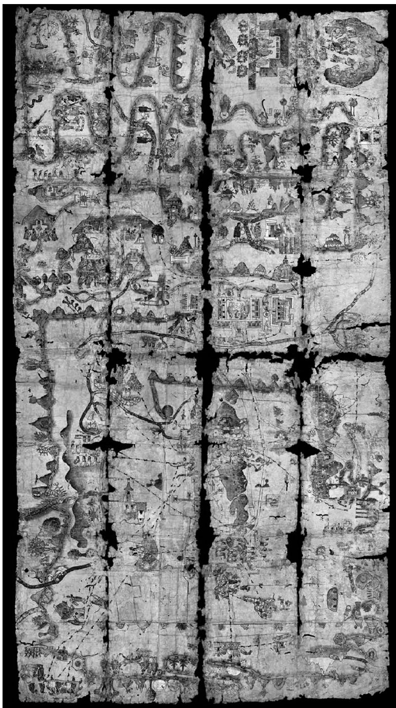
Figura 1. Mapa de Cuauhtinchan núm. 2