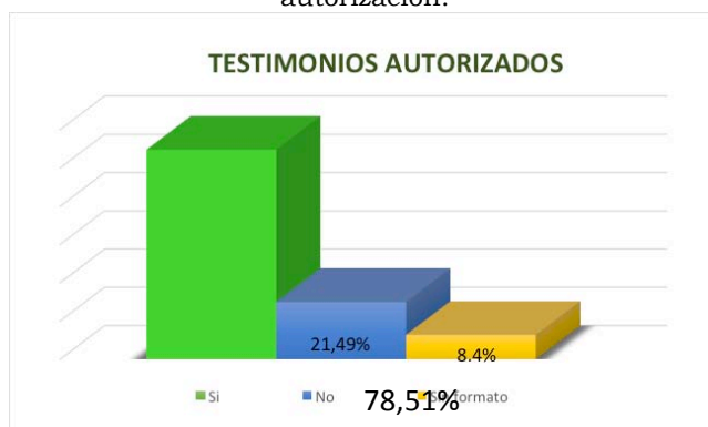
Figura 3. Porcentaje de testimonios con formato de autorización.