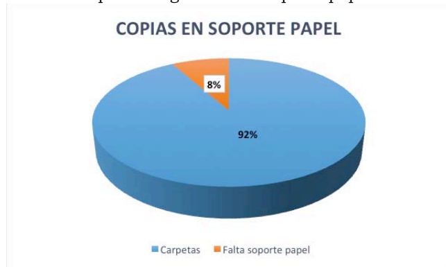
Figura 4. Porcentaje de testimonios que cuentan con copia de seguridad en soporte papel.