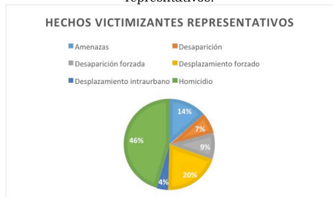
Fuente: Inventario de Testimonios, Proyecto de investigación: Identificación del estado de conservación y realización de inventario de los casos documentados por el Programa de Atención a Víctimas del Conflicto Armado, 2013.