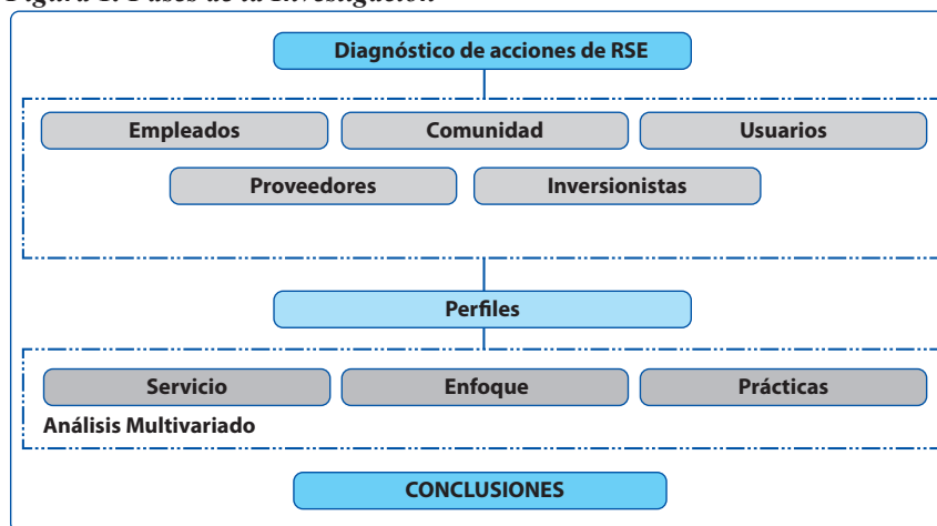
Figura 1. Fases de la Investigación

Posterior a ello se realizó un análisis cuantitativo para determinar la correspondencia entre las diferentes empresas determinado si existían tendencias que permitieran definir perfiles de RSE para estas entidades, este proceso se realizó a través de los resultados que arrojó la encuesta por medio de una técnica de análisis multivariable elaborado con el programa Numerical Taxonomy System (NTSYS) (6).