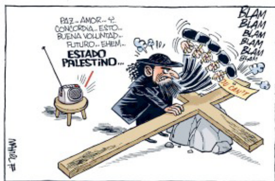
Manel Fontdevila, 2009, diario Público

Para analizar la representación de las religiones se selec-