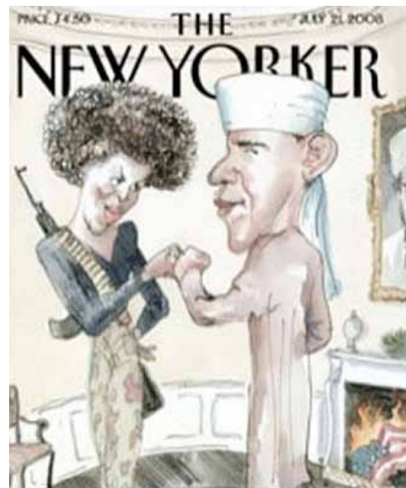
Obama y el islamismo según el New Yorker

su autor pretendía criticar los argumentos conservadores y no al entonces candidato a la Presidencia de los EEUU 8 .