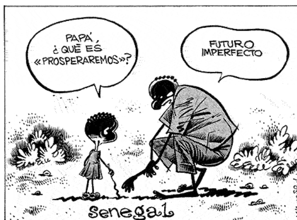
El Mundo, 04/06/06. Modelo conceptual hacia el ambiente social

En torno al mismo hecho, Idígoras y Pachi, en el diario El Mundo , trascienden el acontecimiento específico para situar en un campo de Senegal a un padre que, en la respuesta a su hijo, resume la ausencia de futuro. Aquí la mediación política cede terreno en beneficio de un modelo más conceptual que se centra en la tragedia de la inmigración.