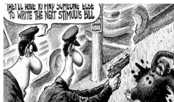
Caricatura del New York Post: ambigüedad del texto

Más clara, desde la óptica del discurso discriminatorio, es la imagen del New York Post en la que dos policías acribillan a un mono, por la ambigüedad del texto: “Tendrán que encontrar a otro para que escriba la próxima ley del estímulo” 9 . Aunque la caricatura podría ser interpretada a partir de un acontecimiento reciente -un chimpancé fue tiroteado en Connecticut- otras lecturas asociaban al animal con el máximo mandatario estadounidense que la vispera había anunciado la ley del estímulo económico.