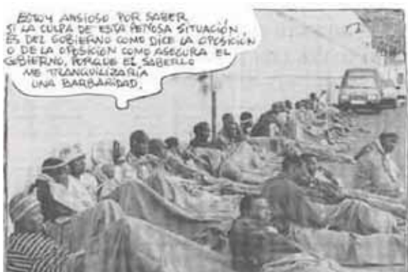
Mingote, ABC, 04/06/06. Modelo referencial hacia el sistema político

El dibujante Mingote, en el diario ABC, reproduce la imagen fotográfica de los inmigrantes. Estamos ante un modelo referencial, que a través de un bocadillo critica la actuación de