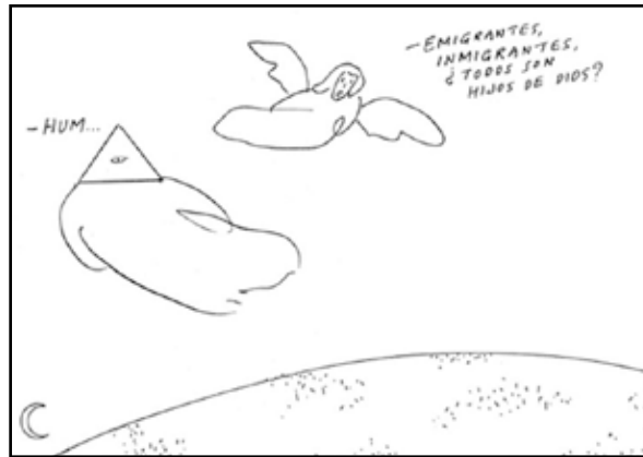
Máximo, El País , 04/06/06. Modelo conceptual hacia el ambiente social

hijos de Dios”, a lo que se responde con un lacónico “hum...”. También trasciende el acontecimiento para realizar una reflexión más general, sobre la desigualdad.