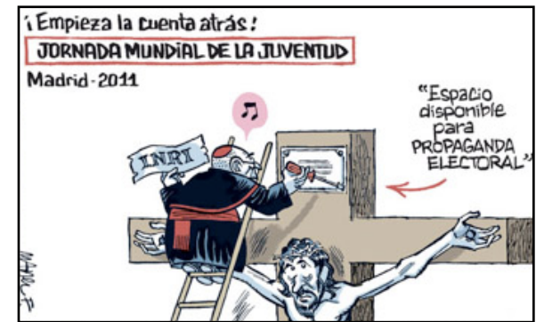
Diario Público , 08/2011 visita de Benedicto XVI a Madrid

Al mismo tiempo, es frecuente que en las viñetas se uti-