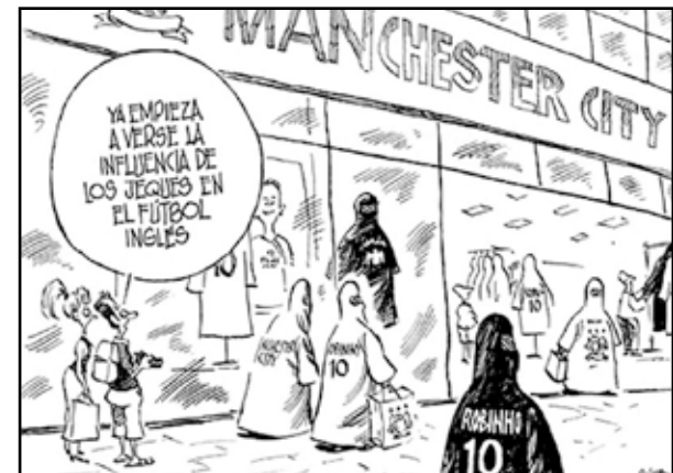
Ricardo, El Mundo , 04/09/09

En esta viñeta ( El Mundo , 04/09/09), el burka es el símbolo