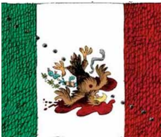
Caricatura sobre la violencia en México

Las identidades nacionales también participan de esta perspectiva crítica. Es el caso de la polémica caricatura firmada por Daryl Cagle publicada en la página web de la cadena estadounidense MSNBC sobre la violencia en México, con una deformación intencionada de la bandera y con el águila tiroteada 6 .