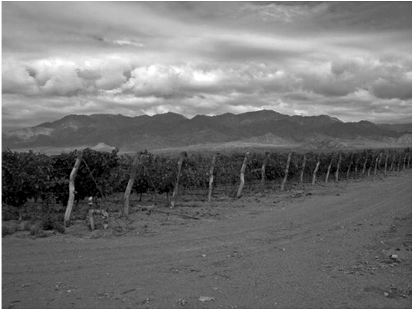
IMAGEN 2. Última finca al oeste del Valle de Uco irrigada con agua de pozo, riego por goteo; viñedos clasificados según varietales y protegidos por malla antigranizo.