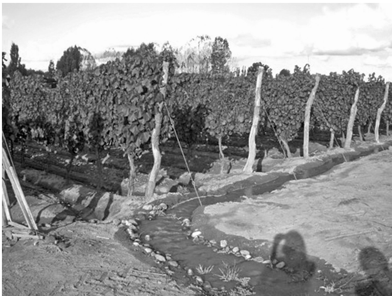
IMAGEN 3. Finca en La Consulta, Valle de Uco. Riego “tradicional”, por surco

labranza que pueda. Ya mañana empiezo a tirar verdeo, le tiro verdeo camellón por medio. Me sirve para abono, me sirve para algún animal que por ahí en el invierno no tiene mucha comida, y así lo aprovecho [...] hay otros que riegan por goteo, que economizan agua dicen, pero yo sigo haciendo riego tradicional [riego por surco] (Entrevista, febrero 2014).