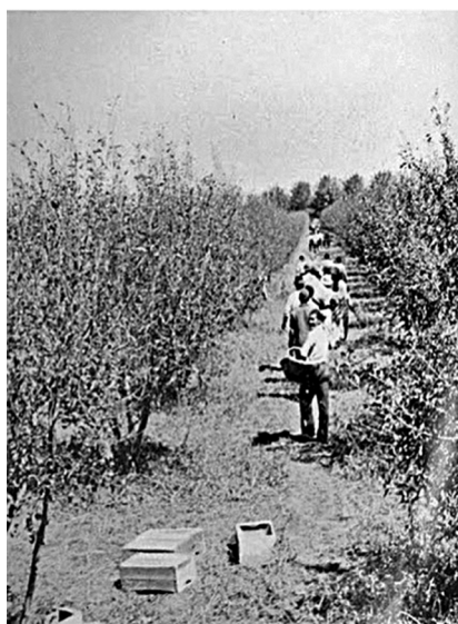
IMAGEN 1. COSECHADORES DE MANZANA EN TUNUYÁN, 1941