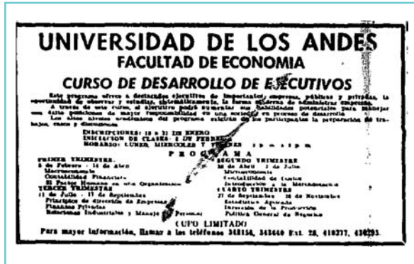
Figura 3. Aviso de prensa de la Universidad de Los Andes promocionando sus “Cursos para Ejecutivos”.