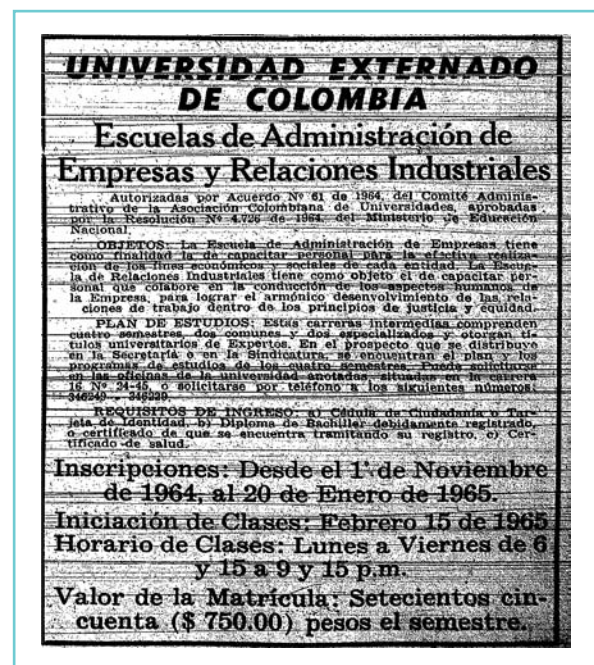
Figura 1. Aviso de prensa de la Universidad Externado de Colombia anunciando la apertura de la Escuela de Administración de Empresas y Relaciones Industriales.

En el Externado de Colombia se inició la oferta de estudios de administración en conocimientos de relaciones industriales antes de obtener autorización del Estado para ofrecer el título profesional de administrador de empresas. Por tanto, en esta Universidad se otorgó con anterioridad el título de “Experto en Relaciones Industriales” y no el de administrador de empresas.