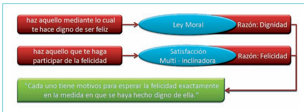
Gráfica 1. La felicidad y la dignidad.

Fuente: Victoria Camps, Ética de esperanza . Diseño del autor.