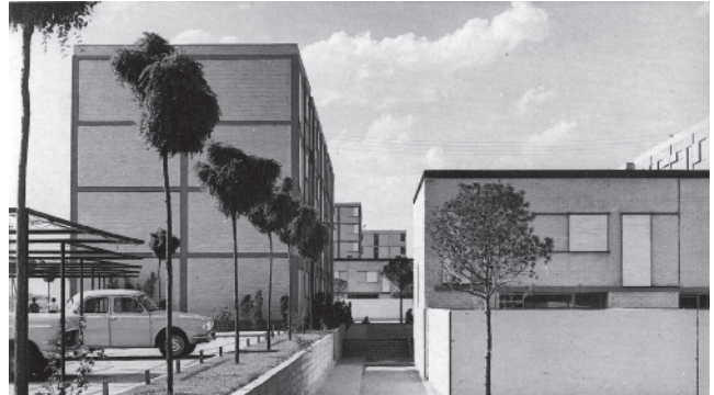
Fig.8 Poblado dirigido de Caño Roto, Madrid.

MADRID. De arriba hacia abajo: Poblado dirigido de Caño Roto (A. ásquez de Castro, I. Odoñez). (Fig. 8); Poblado dirigido de Entrevías (F.J. Sáenz de Oíza). (Fig.10); Torres del poblado de Batán (J.L. Romany, Sáenz de Oíza). (Fig. 12).