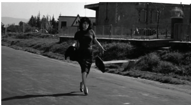
Fig.5 Neorrealismo Italiano: “Mamma Roma”