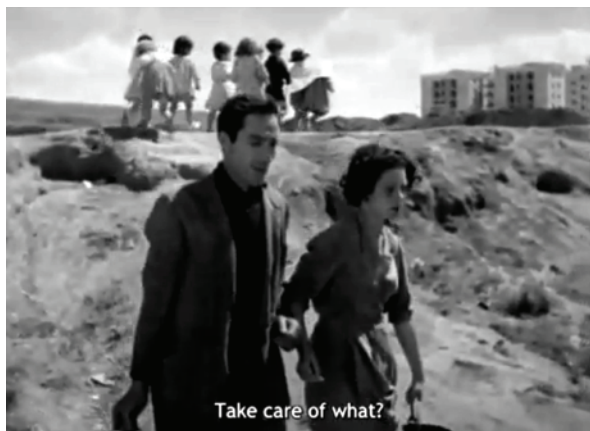
Fig.3 Neorrealismo Italiano: “Ladrones de Bicicletas”

Fuente: Vittorio De Sica, Ladrones de bicicletas, Italia, 1948, Fotograma.