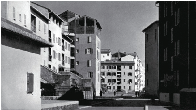
Fig.7 Barrio Tiburtino, Roma