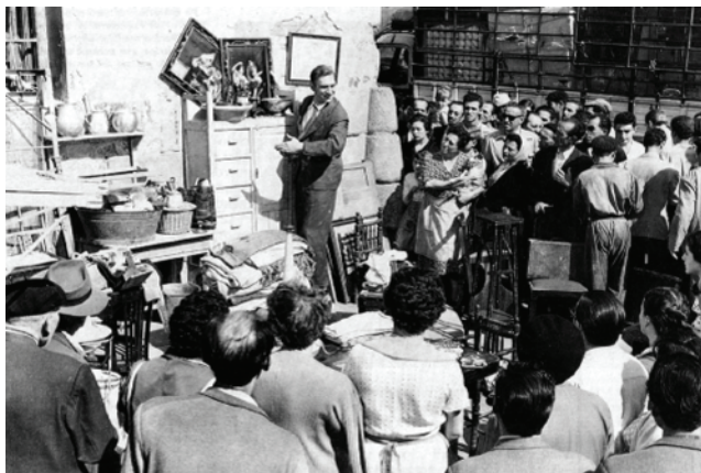
Fig.2 Neorrealismo Español: “El Inquilino”