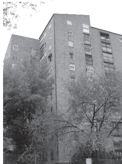
Fig.12 Torres del poblado de Batán, Madrid