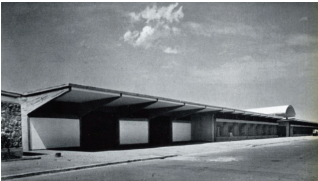
Fig. 9 Unidad de habitación horizontal del Tuscolano, Roma.