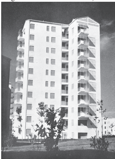
Fig.11 Torres del Tuscolano II, Roma

Fuente: Vagnetti, Luigi. «El problema de la vivienda en Italia. Plan Fanfani.» Informe de la Construcción, n° 64 (1954): s.p.