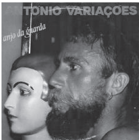
FIGURA 1 – capa do álbum Anjo da guarda (1982)

Magalhães, futuro líder do Heróis do Mar e do Madredeus) na qual cabiam influências que iam do fado às melodias tradicionais do Minho, e que partia de uma visão de mundo profundamente ligada à vivência aldeã para hibridizá-la com elementos kitsch